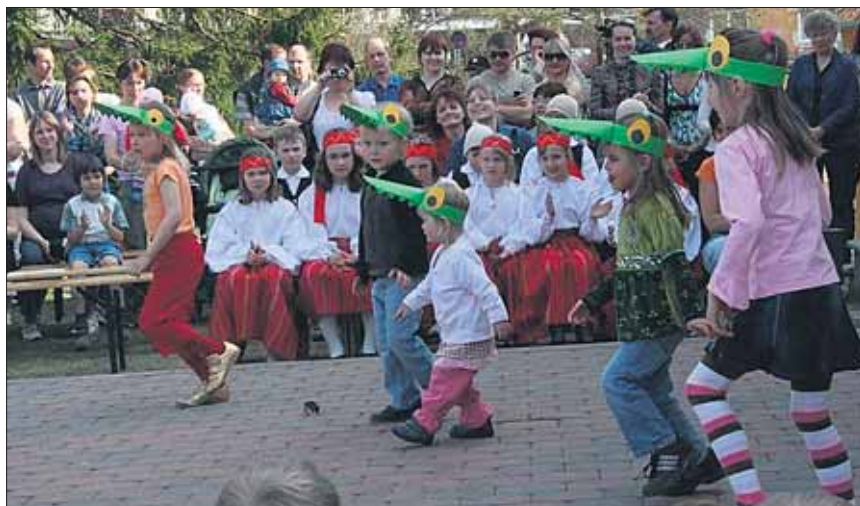
● Tänaõhtu lapsed esitavad krokodillantsu.