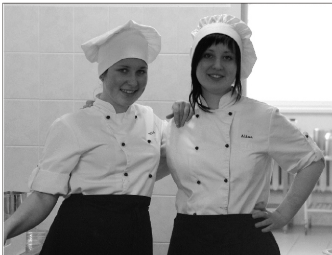
Tallinna Teeninduskooli tüdrukud Olustvere sööklas