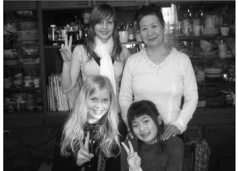
Koos teetseremoonia õpetajaga