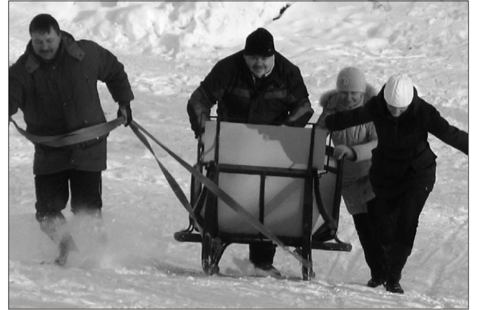
Saaniga tagasi mäele