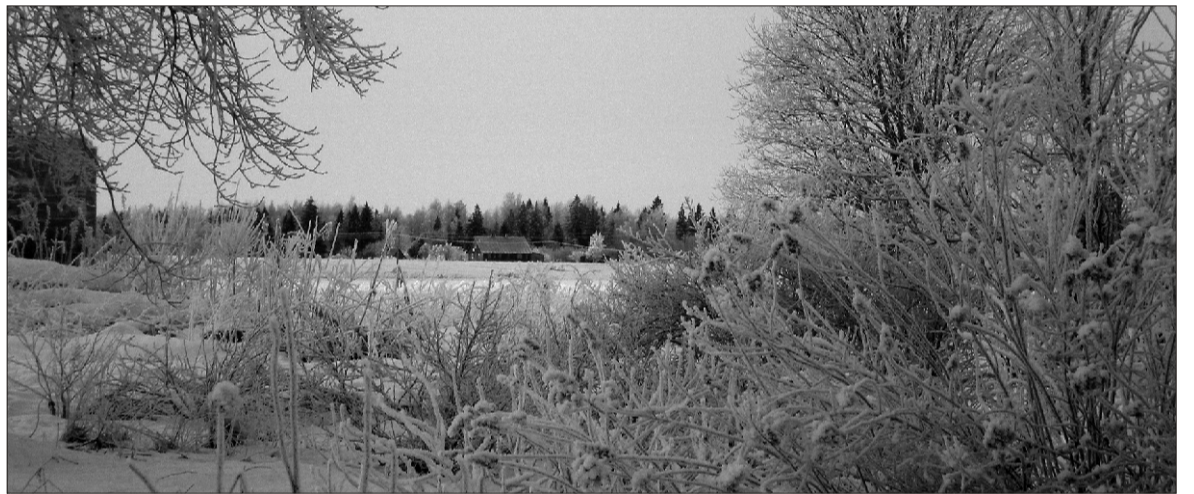
Minu kodukoha kaunimad pildid