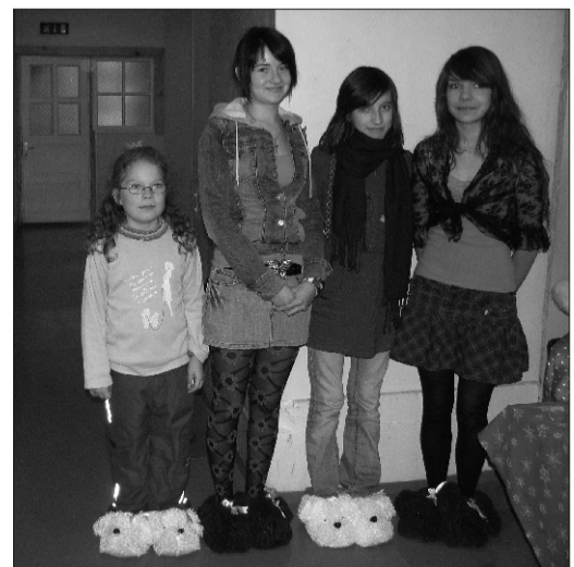
Sussipäeval Kildu koolis