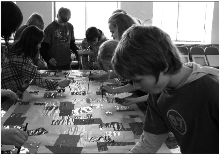
Oskusainete nädal - kunstiga tegelemise päev.