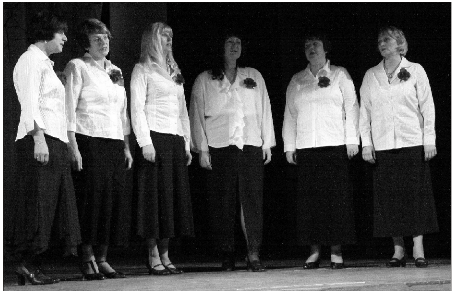
Suure-Jaani valla kõige noorem taidluskollektiiv - Vastemõisa naisansambel, kelle jaoks esinemine Vastemõisa rahvamajas toimunud isetegevuslaste kontserdil oli alles teine avalik ülesastumine - esimest korda oldi publiku ees 2008. aasta 19. detsembril, kui toimus Vastemõisa kandi eakate jõulupidu.