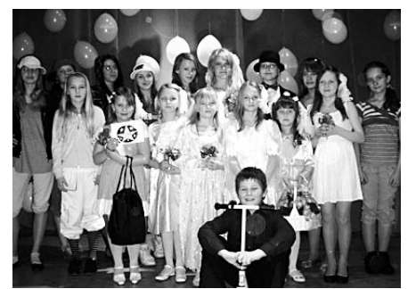
Palupera Põhikooli õpilased saavutasid 16. veebruaril Tartumaa Konguta kooli playbackil „Muusikaga narko vastu” vanemas vanusegrupis esikoha.

Matkamängu toetab SA Keskkonnainvesteeringute Keskus.