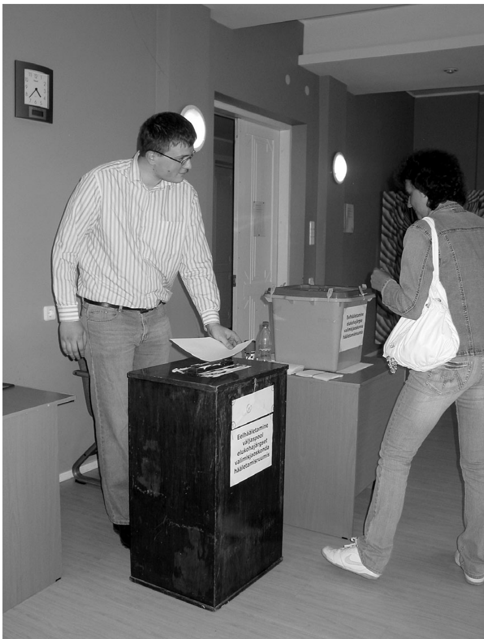
Elvalased eelistasid neil valimistel Indrek Tarandit ja Reformierakonda.

Keskerakond tegi valimiste nädalal Sinilinnu ees innukalt propagandat, mis Elva linnas küll oluliselt valimistulemust ei mõjutanud, sest elvalane on kindlalt olnud reformierakonna meelne. Mõnevõrra üllatav oli seetõttu Rahvaliidu vilets tulemus Rõngus (ainult 20 häält) ja Nõos (vaid 32 häält) ning Reformierakonna hea tulemus Kongutas ja IRLi võit Nõos. Rannus jäid aga valijad kindlalt truuks Rahvaliidule.