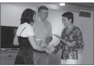
Vallavalitsus tänas tegijaid lk 5