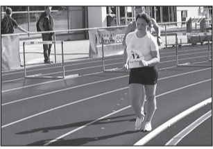
Kergejõustiklased naasid medalitega lk 6