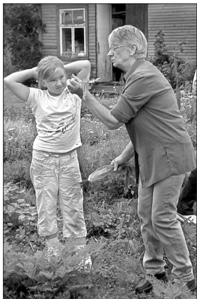
PEEDOSAARÕ KAISA PILDI «Mis mõro, tuu hää!» opäs Kutkina Liisi ravihaino pruukma.

Maaja mõist tetä väega mitund sorti käsitüüd. A Pokumaal kävven jäi külh silmä, et timä leevänumbri om iks viltmine: neo asa, mis täl ütine olf võedu, olf nii ilosa, et mõista-i tuud kuigi sõnnoga kirja panda.