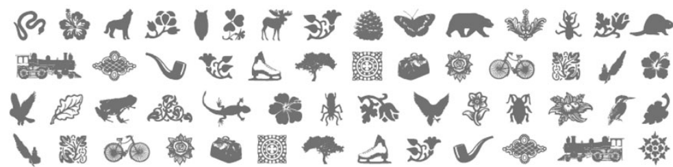
Fragment bordüürist, mis hakkab ehitama praegu veel tühje seinu.