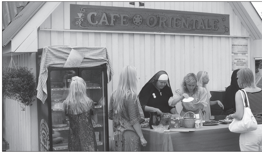
Kohvikusse, kus kliendile valab tassitäie mõnusat jooki Pirita kloostris abtiss, ei satu just tihti. Cafe Orientales osutus see võimalikuks.

Sel aastal oma kodulinna 70. juubelit tähistav Kärkla rahvas on aga välja mõelnud hoopis iselaadse aktsiooni – 15 ühepäevakohvikut. Augustikuu esimesel nädalavahetusel toimunud kohvikutepäev leidis aset juba teist korda, mis näitab, et eelmisel aastal algatatud idee leidis piisavalt positiivset vastukaja. Vaid ühel päeval aastas tegutsevad Kärklas korraka koguni 15 kohvikut, mis asuvad kogu linnas, romantilistes aiasopikestes ja rohelusse uppuvatel tänavatel. Kohvilähkriteks tuntud Kärkla elanikud on asja täie tõsidusega võtnud – kohvikud on sisse seatud kodusõu- ja hoo-vides, merel ja muuseumis, koguni palvemajas... Ühepäevakohvikud on nii ainulaadsed ja kordumatu ja seega tuleb külalastajatel varuda kogu päev, et kõigis neis kohtades peatuda ning kohvi nautida jõuaks. Kaugemalt tulnud linna külalastajad said palju abi kaardist, kus kenasti ära märgitud, millisel tänavalt ühe või teise kohvikule leida võib. Peab kiitma korraldajate nu-