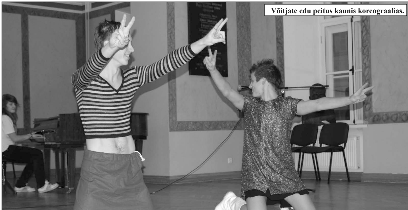
Võitjate edu peitus kaunis koreograafias.