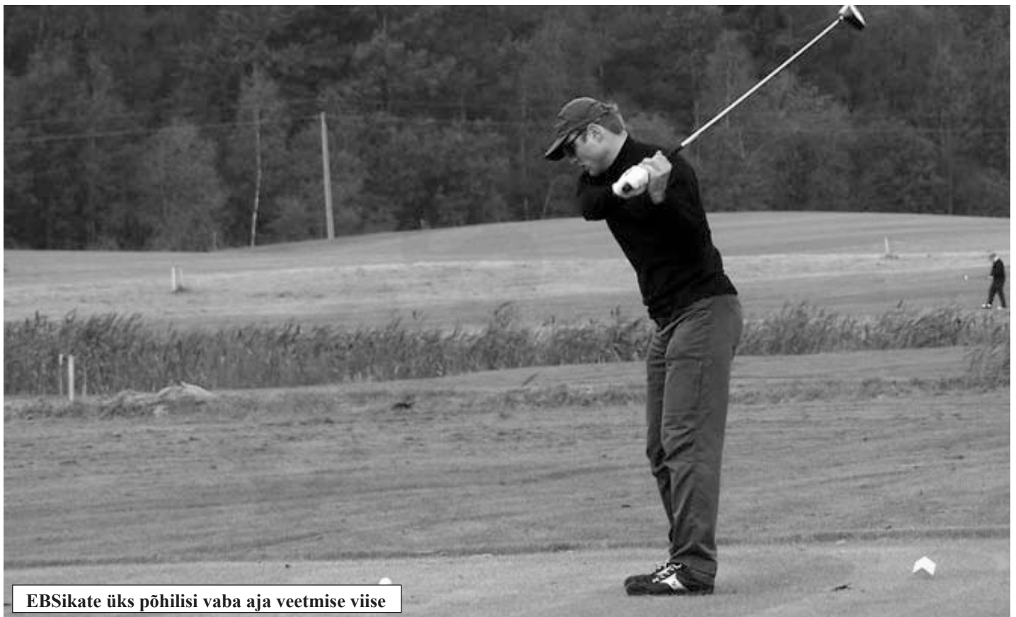
EBSikate üks põhilisi vaba aja veetmise viise

Eesti Nokia võiks olla eestlaste suhtumise muutmine. Eestlaslik küünilisus ja kahjurõõm on inetud. Peaksime üksteist rohkem innustama. Ettevõtlikkus, positiivsus ja nutikus peaksid olema meie edasiviivad jõud ja eriti nüüd tuleb nii riigil kui ka ettevõtjatel seljad kokku panna.