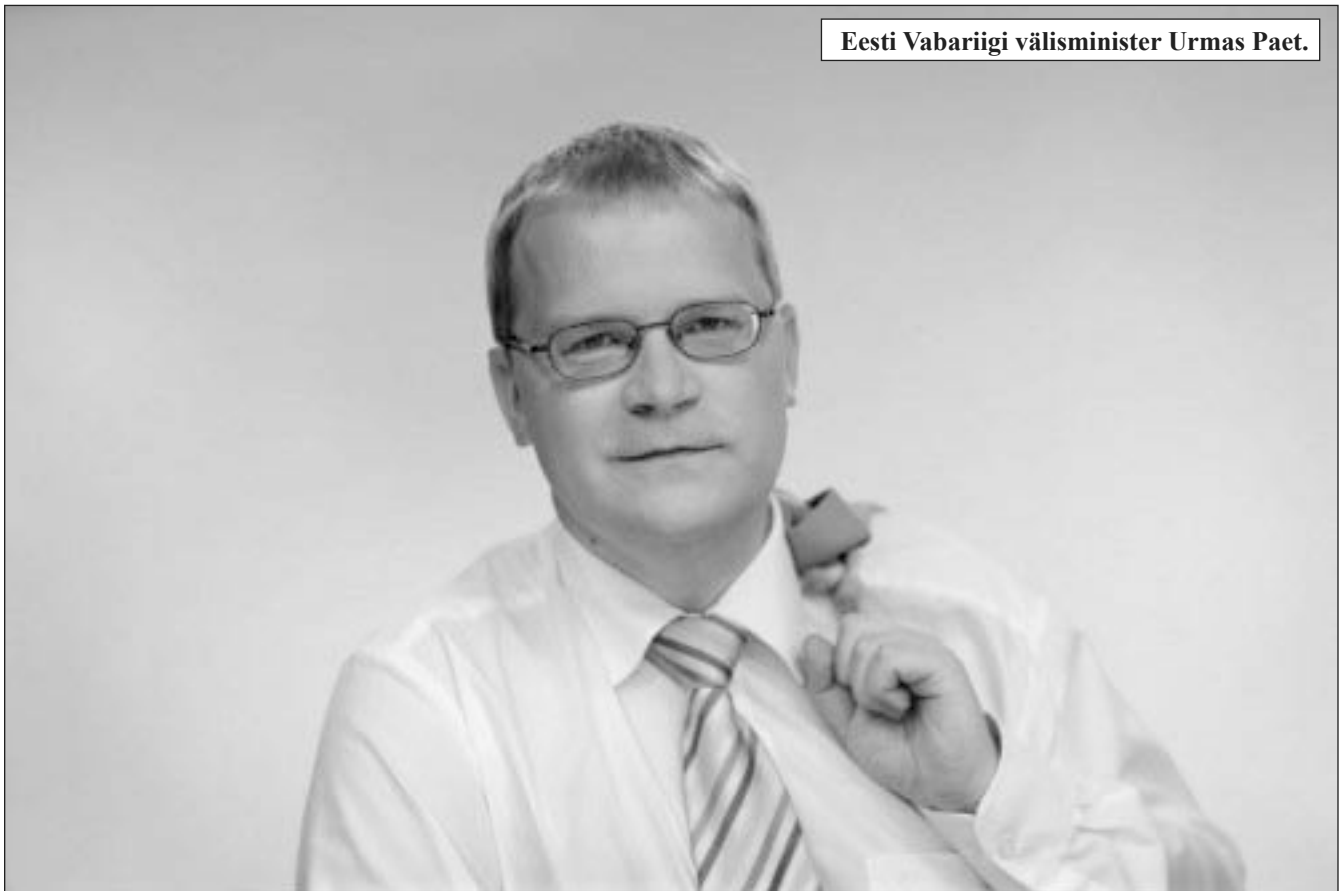
Eesti Vabariigi välisminister Urmas Paet.

vastuvõtt“. Saatekülaliseks oli nimelt Urmas Paet. Välisministrit ei olnud ma ikka näinud ning nii ootasin tema saabumist fuajees. Äkki sisenes uksest keskmisest