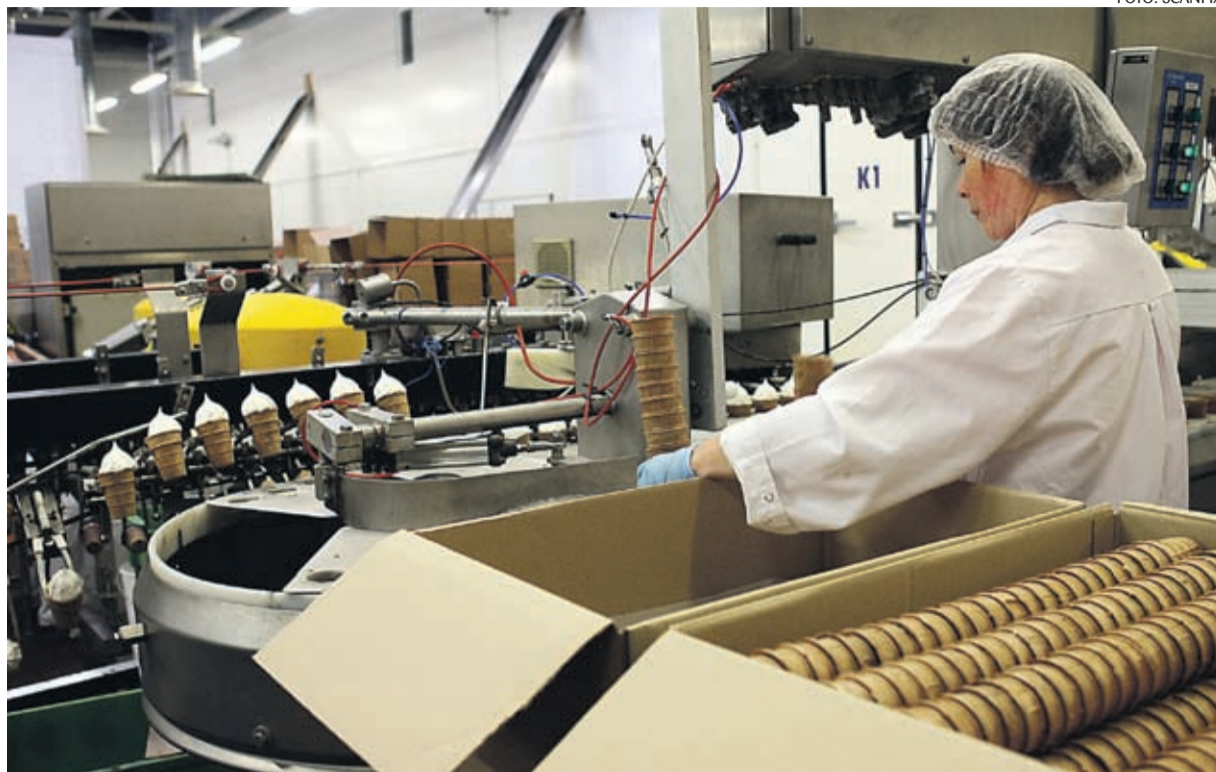
Jäätisetegu on huvitav, kuid elu jooksul tasub proovida ka teisi ameteid.

Eelnõu on suunatud kogu meie riigi arengule, millest võivad nii töötajad kui tööandjad. Ettevõtjale on oluline eelnõu läbiv paindlikkus – töösuhte lõpetamine on lihtsam kui enne. Koondamised on valus teema, kuid ettevõtteid ei saa ega suuda kogu majanduses toimuvat nii hästi ette ennustada. Laias laastus võib öelda, et kolme aastaga kaovad umbes pooled ettevõtteid. Olen kindel, et ettevõtja ei alusta tegevust selleks, et paari aasta pärast oma töötajaid koondata hakata.