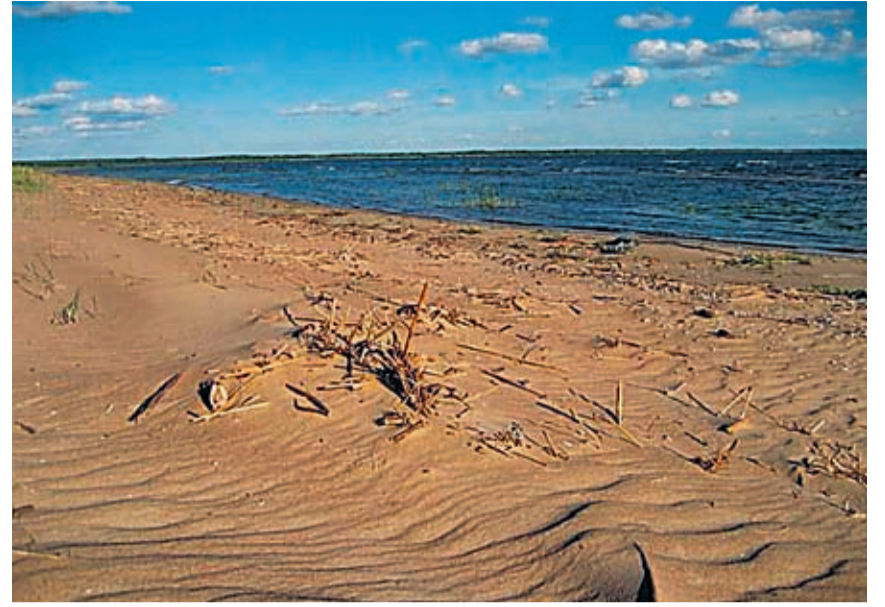
Peipsi põhjarannikul asuvad liivaluited.

REFORMIERAKOND Tõnismägi 9 10119 TALLINN