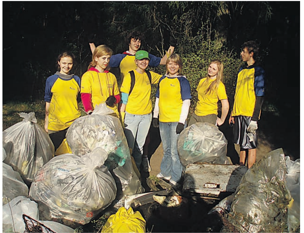
Virumaal möödus koristuspäev lõbusas, kuid töökas meeleolus.

Koristasime Toila ja Martsa vahelist pankranniku teed. Kokku saadi 15 suurt kotti prügi. Enamus prügi oli suitsupakid, alkoholipudelid ning arvatavasti sellel teelõigul elavate inimeste prügikotid. Koristajaid oli kokku viis ja koristatud saadi kolme tunni jooksul. Kõik oli väga lõbus. Vahva oli ka