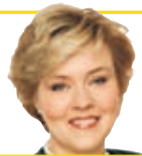
Maret Maripuu, Eesti Vabariigi sotsiaalminister

Uue töölepinguseaduse eelnõu peamised märksõnad on õppiv inimene ja ettevõtjasõbralik majanduskeskkond, sest see soodustab õppimist ja pidevat enesetäiendamist. Need omakorda aitavad kaasa majanduse elavdamisele.