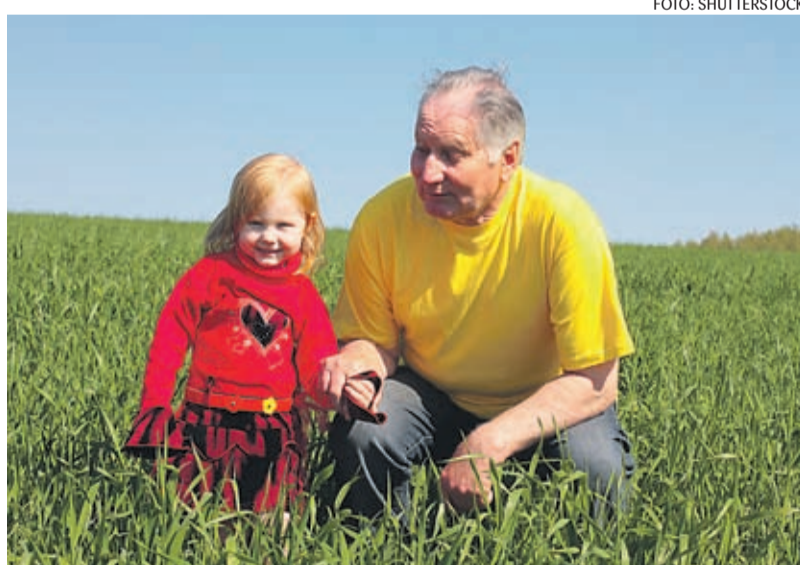
Noored pered ja eakad võivad loota riigi toele.

Mõnede kuluartiklite puhul sai eelarve vähendamise võimalikuks tänu eelmisest, 2007. aastast ületulnud vahendite. Näiteks erivajadustega laste rehabilitatsiooniraha puhul on prognoositud võimalik kulude kokkuhoid 25 miljonit krooni. Siin lähuti esimese kvartali tegelikest kuludest ja võeti aluseks 2007. aastast ületulnud vahendid 32,3 miljonit ning