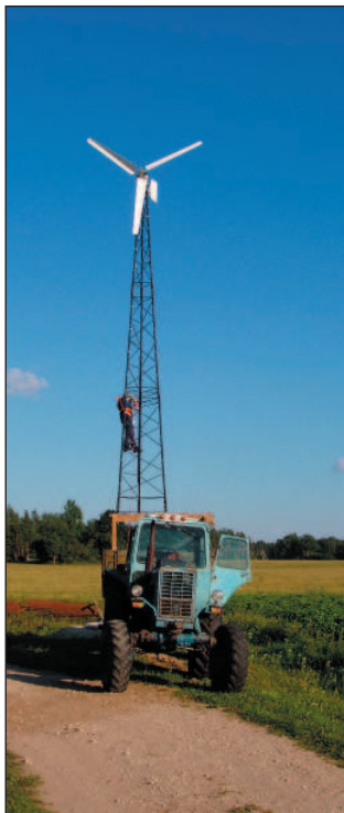
Nii toredast tuulikust ei kannata traktoriga möödagi sõita, kohe kange himu tuleb otsa ronida.

Saare talu vajab kuus 700–800 kilovatt-tundi elektrit. Ukraina päritolu 1,5 kilovattine tuulegeneraator Windelectric toodab paberite järgi kuus 500 kilovatt-tundi voolu. Täisautomaatne süsteem lülitab majapidamise tuule nõrgenedes üldisse elektrivõrku ning vastupidi, vooluallika vahetus end inimeste elus tunda ei anna.