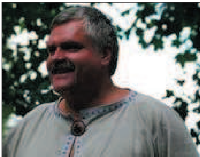
Seekordse Maapäeva elus maskott: Kalevipoeg.

Arutleti, kuidas saab kogukond aidata kultuuripärandit ja loodust säilitada.