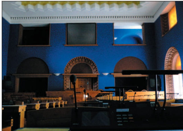
Istungi järel muutus vastne lahinguväli riigikogu saalis taas sama tühjaks ja kõledaks kui enne seda.