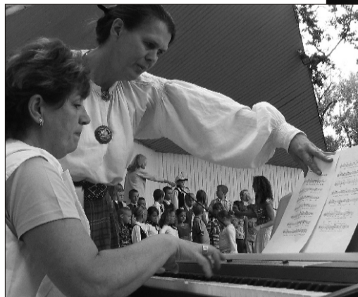
Proove tegid ka koorid >>