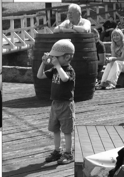
Vabalava väike foto- > graaf