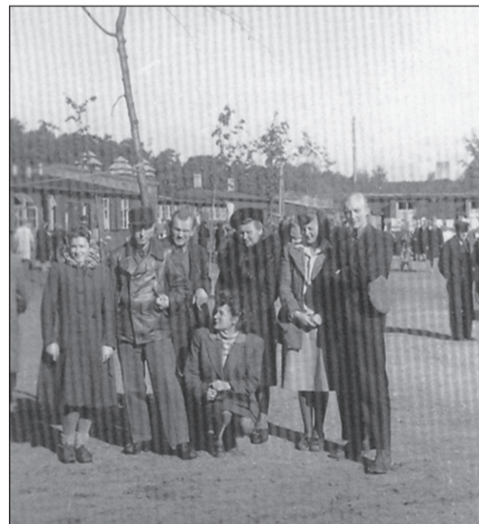
Laevadega Saksamaale pääsenud eestlased Brandenburg-Haveli läbikäigulaagris 3. oktoobril 1944.