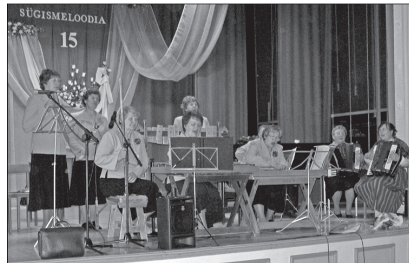
Esineb rahvapilliorkester Sinilill .