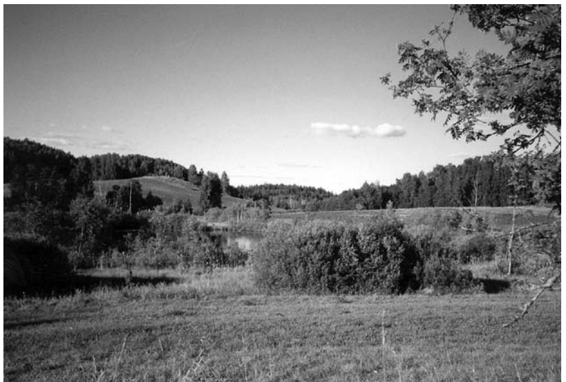
Karula rahvusparki ütes kaitsõsihis om kaitsaq Lõuna-Eesti esiqumatsit mõtsatsit ja järviliidsi maid.

Urmas Roht Luuduskaitsõkeskusõ Põlva-Valga-Võro piirkunna direktri