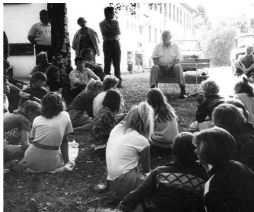
Loeng Loosi koolimaja man.