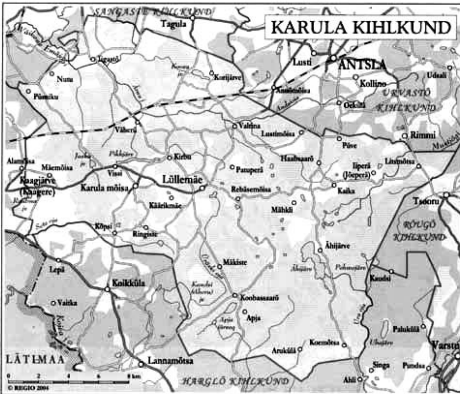
Karula kihlkund parhillaidsi piirega.

Päält kihlkundõ ja maakundõ perrä jagamisõ olli muistitsõn Eestin ka vakusõq ja kandsipiirkunnaq. Tuu kotusõ päält kaiõn paistus, et maiõ läänes jagamisõl, midä tetti Otõpääil ja minkast kõnõldas Henrigu Liivimaa aigraamatun, jaeti vallutajilõ maid muistitsidõ vakussidõ viisi, mitte kihlkundõ perrä, nigu mõnõq uurjaq ommaq arvanuq. Henrik tarvitastuu jaos terminit kylegunda , miä võisiq ollaq muistidsõ Eesti vakusõ vastõq. Henrigu aigraamadu perrä või arvadaq, et tuul aol oll' Ugandi maakunnan vakussidõ kõrd jo vällä kujonuq.