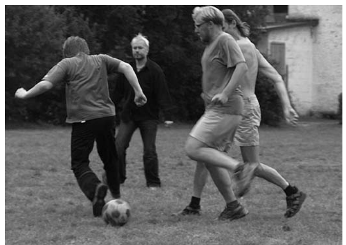
Jalgpall Vanan-Koiolan 2004.