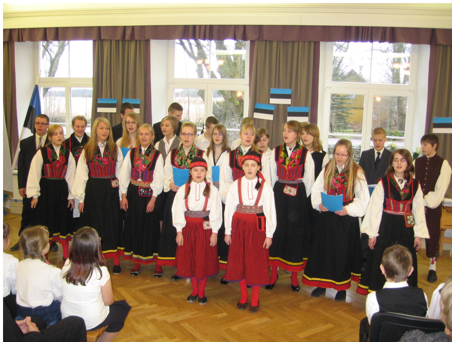
Pildil: Vabariigi aastapäeva aktus Lümanda Põhikoolis