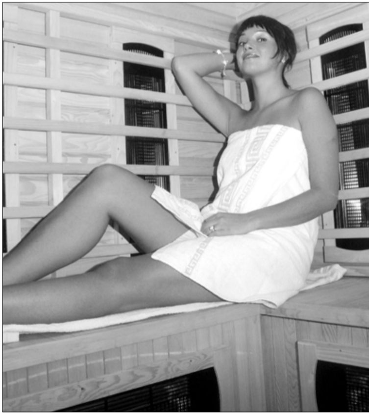
Ülemisel pildil on puhkenurk lõõgastuskeskuses ja alumisel saunamõnude nautimine infrapunasaunas.