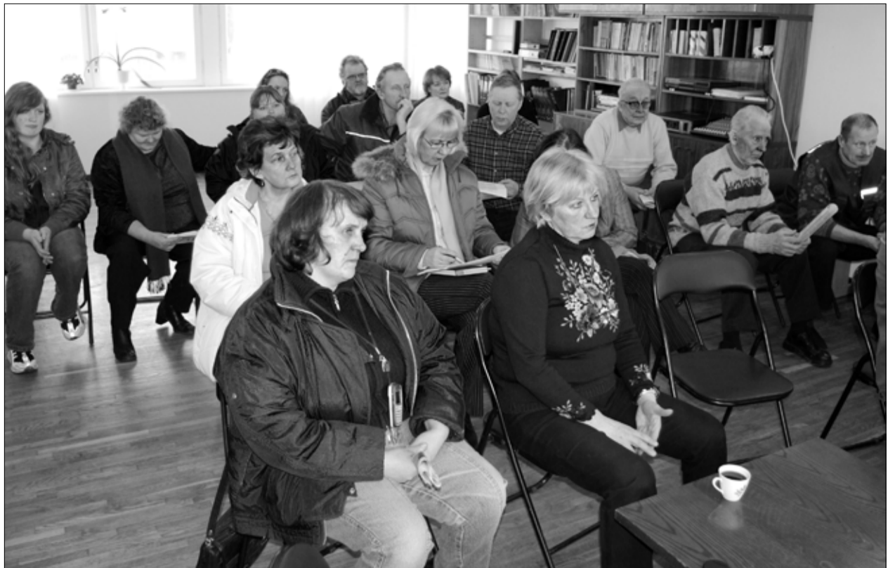
Tapa valla Lehtse teeninduspunkti saali oli kogunenud arvukalt inimesi, kes olid kõik huvitatud Lehtse kandi külaelu elavdamisest.