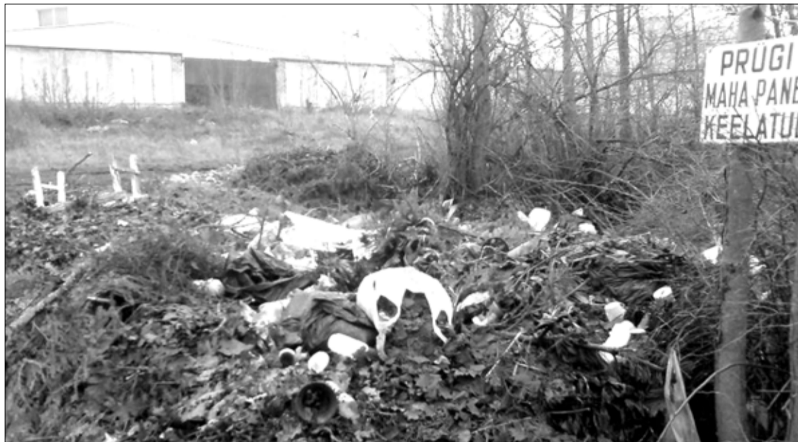
Tapa kalmistul ladustatakse rämpsud ja jäätmeid lausa prügi mahapanekut keelava sildi kõrval.