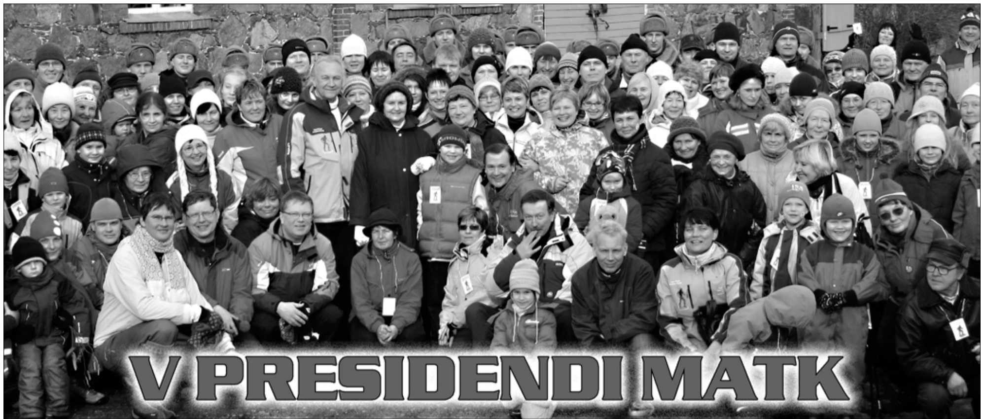
V presidendimatkal tehti Jänedal Musta Täku Talli ees ka juba traditsiooniliseks saanud ühispilt koos president Arndold Rüütliga.