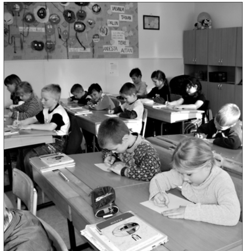
Tapa gümnaasiumi 1. b klassi õpilased harjutasid sel teisipäeval hoolega ilusa käekirjaga kirjutamist.