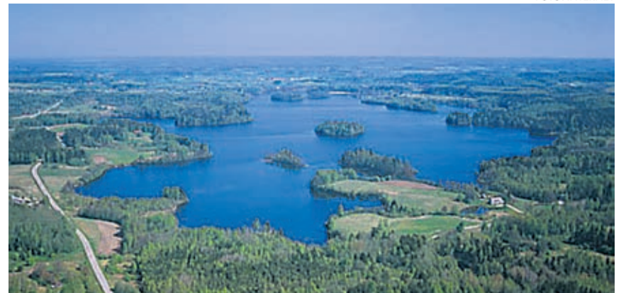
Otepää ümbruse loodus on vahelduv.

REFORMIERAKOND Tõnismägi 9 10119 TALLINN