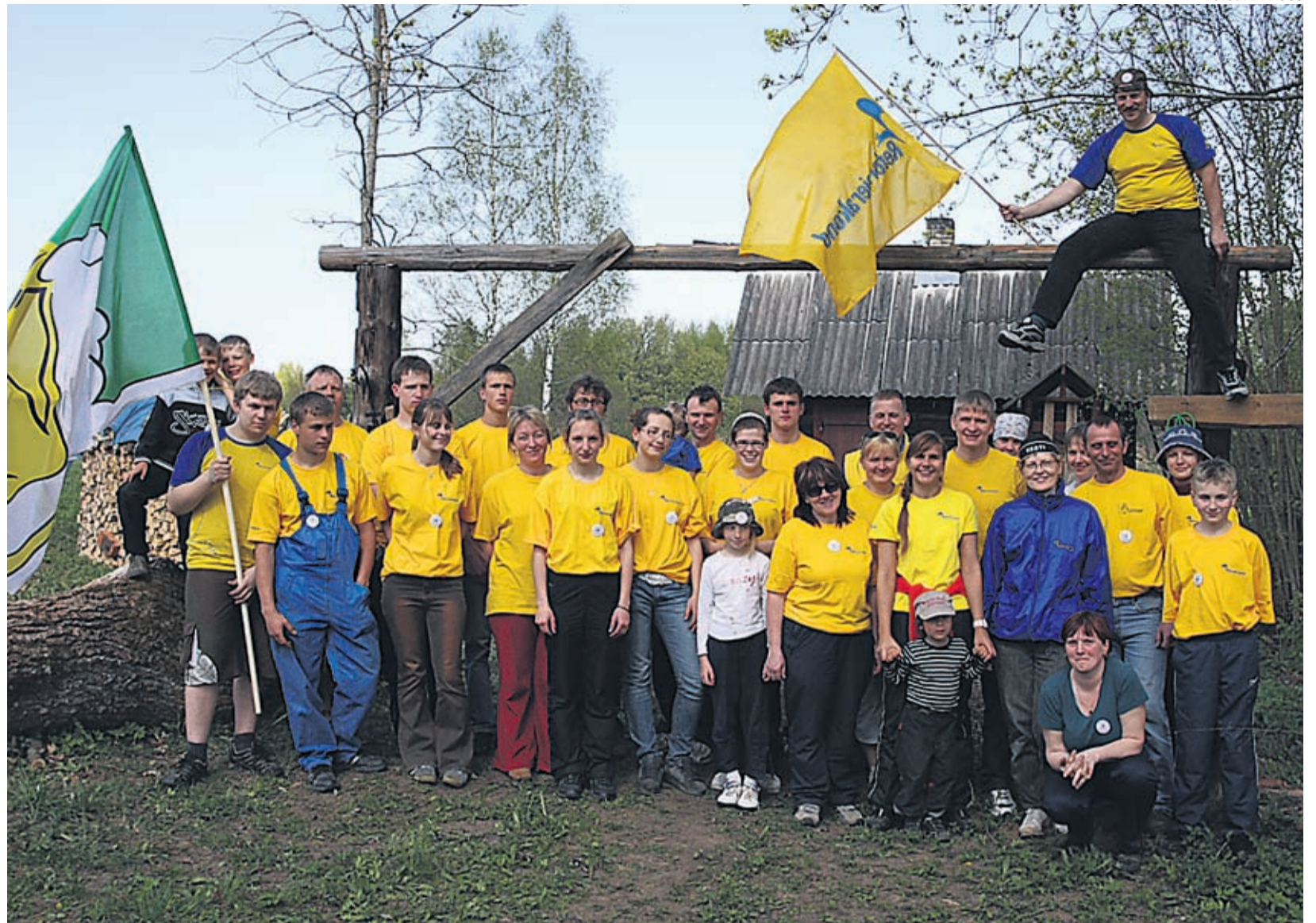
Põlvamaal kogunes Teeme Ära 2008 prügikoristusaksioonile tublisti vabatahtlikke Reformierakonnast.

Majanduse tsüklilisus on üldteada tõsiasi. Eesti jaoks on oluline väljuda kahanevast majandustsüklisest ajumahuka majandusega, kus enam poleks juhtival kohal allhange või toorainevahendus, vaid teadussaavutustel ja Eesti inimeste nutikusel põhinevad tooted. Maailma ja Eestit ootavad eelseisval paaril kümnendil vähemalt sama suured muutused, kui on olnud need, mis leidsid aset viimase kahekümne aasta jooksul. Eesti edu valem on olla muutusteks valmis ja pakkuda ise välja mudeleid positiivseteks muutusteks nii riigi, valla kui ka miks mitte iga inimese tasandil.