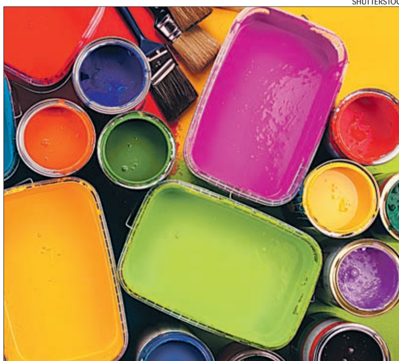
Märjamaa värvikampaania muutub iga aastaga järjest populaarsemaks.