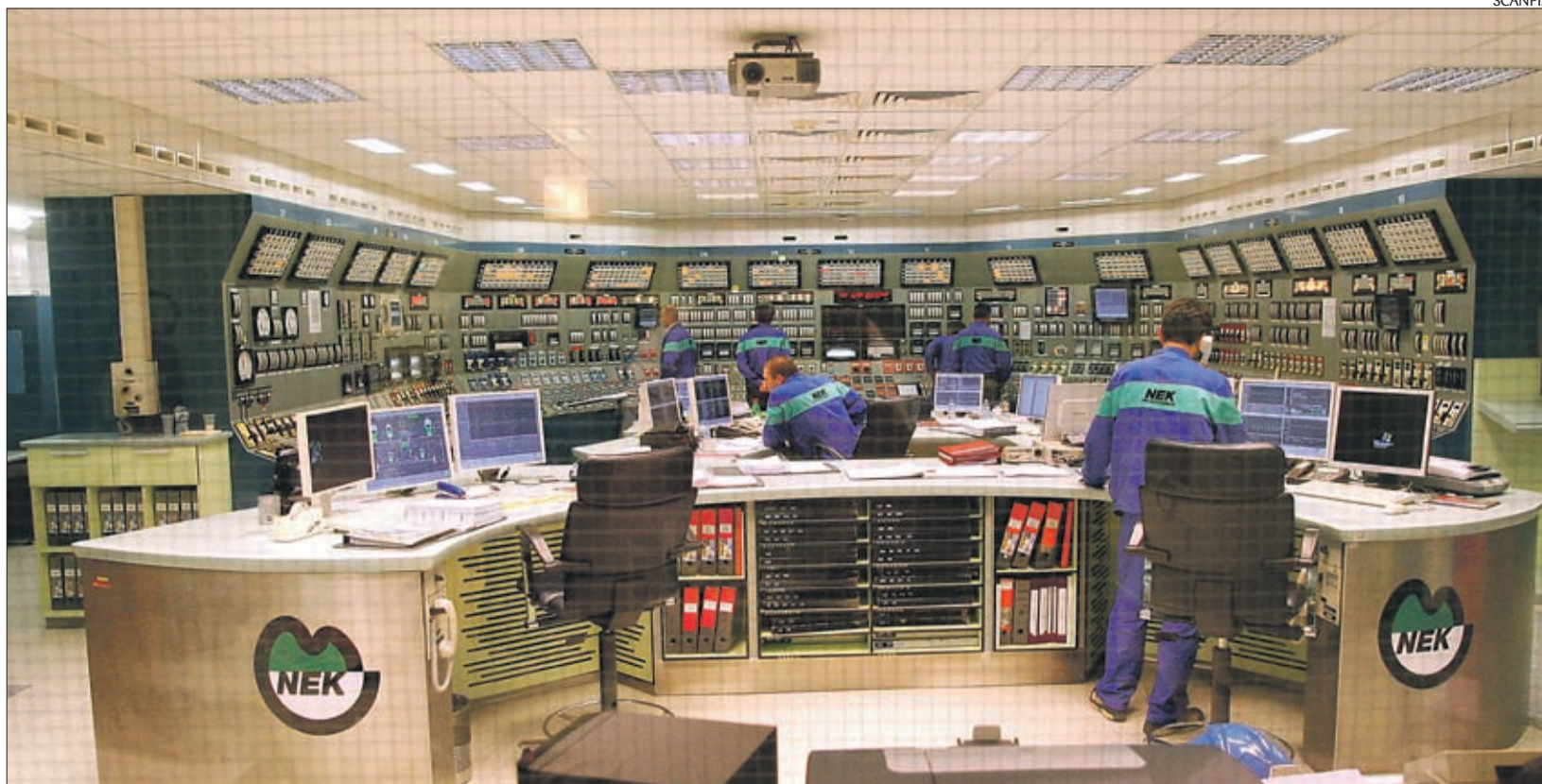
Moodsa tuumajaama rajamine on keerukas ja aeganõudev tegevus, mis nõuab vastava seadusandluse olemasolu.