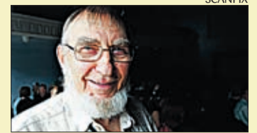
Üllatusesinejaks oli kutsutud Veljo Tormis.