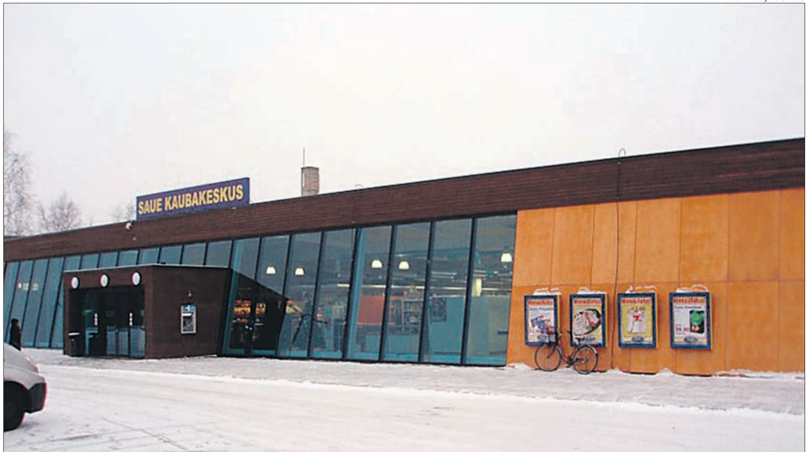
Laienenud Saue kaubanduskeskus avardab kohalike tarbimisvõimalusi.