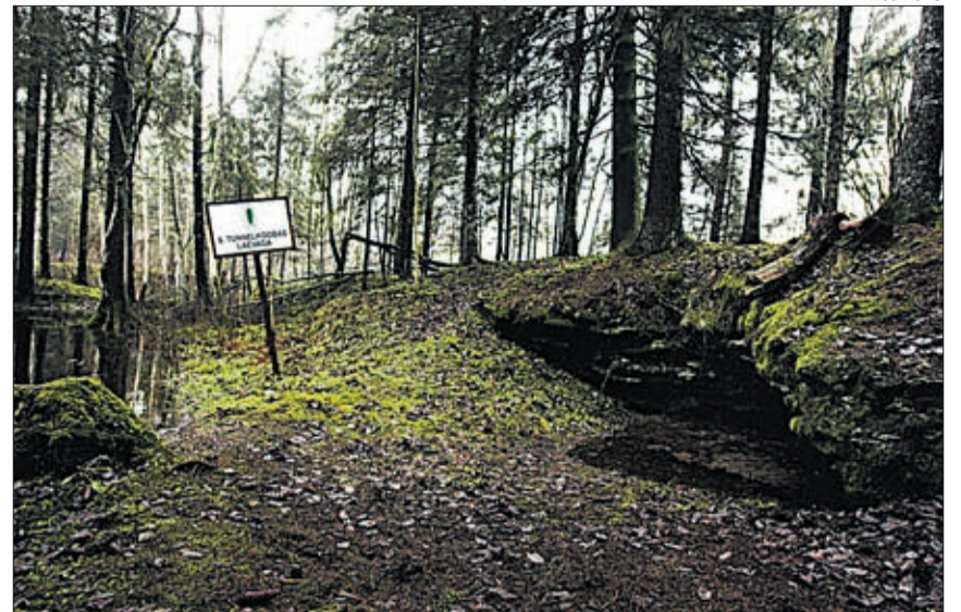
Kuimetsa karstiala on tuntud ka lida urgetena.

REFORMIERAKOND Tõnismägi 9 10119 TALLINN