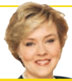
Maret Maripuu, Eesti Vabariigi sotsiaalminister

Uue töölepinguseaduse eelnõu peamised märksõnad on õppiv inimene ja ettevõtjasõbralik majanduskeskkond, sest see soodustab õppimist ja pidevat enesetäiendamist. Need omakorda aitavad kaasa majanduse elavdamisele.