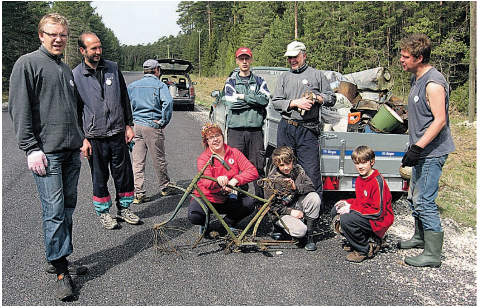
Hiiumaal leidsid koristajad metsa alt vana jalgrattaraami, mida ka pildile jäädvustamiseks eksponeeriti.

Majanduse tsüklilisus on üldteada tõsiasi. Eesti jaoks on oluline väljuda kahanevast majandustsüklisest ajumahu ka majandusega, kus enam poleks juhtival kohal allhange või toorainevahendus, vaid teadussaavutustel ja Eesti inimeste nutikusel põhinevad tooted. Maailma ja Eestit ootavad eelseisval paaril kümnendil vähemalt sama suured muutused, kui on olnud need, mis leidsid aset viimase kahekümne aasta jooksul. Eesti edu valem on olla muutusteks valmis ja pakkuda ise välja mudeleid positiivseteks muutusteks nii riigi, valla kui ka miks mitte iga inimese tasandil.