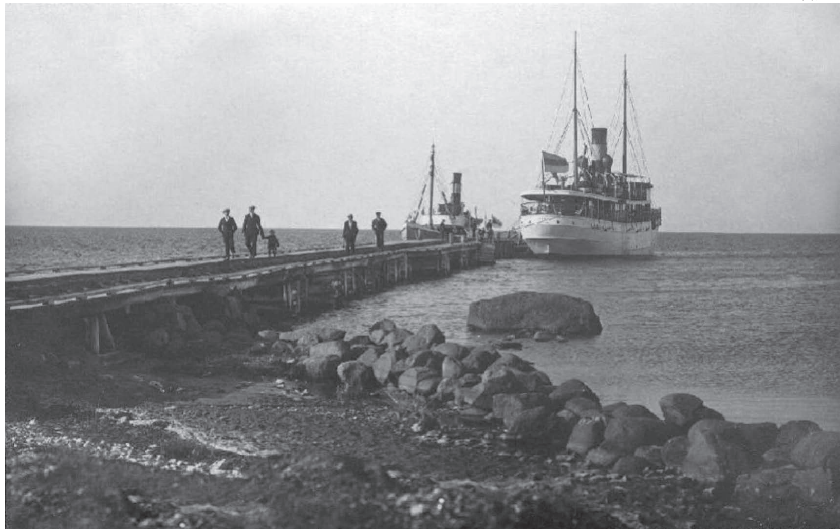
Selline nägi Kärdla sadam, mis hävis II maailmasõja ajal, välja eelmise sajandi algusaastatel.