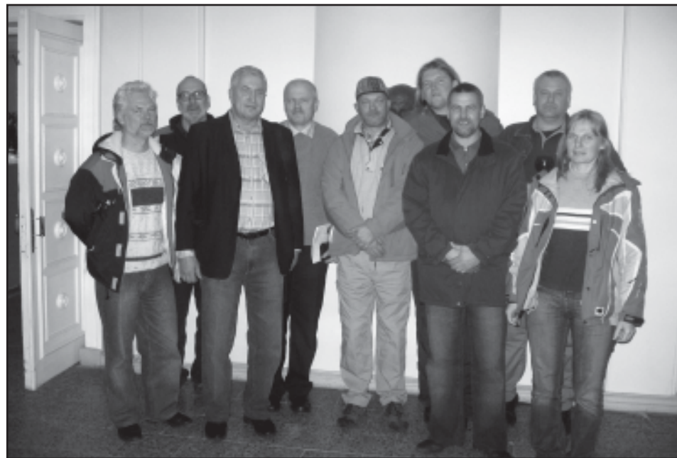
Röpina Valla mälumängurid Otepää Kultuurikeskuses