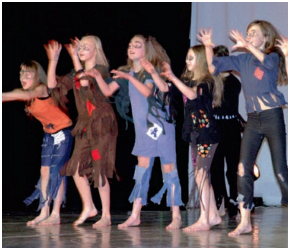
Jõgeva huvikooli tantsustuudio tüdrukud Koolitantsul 2008.