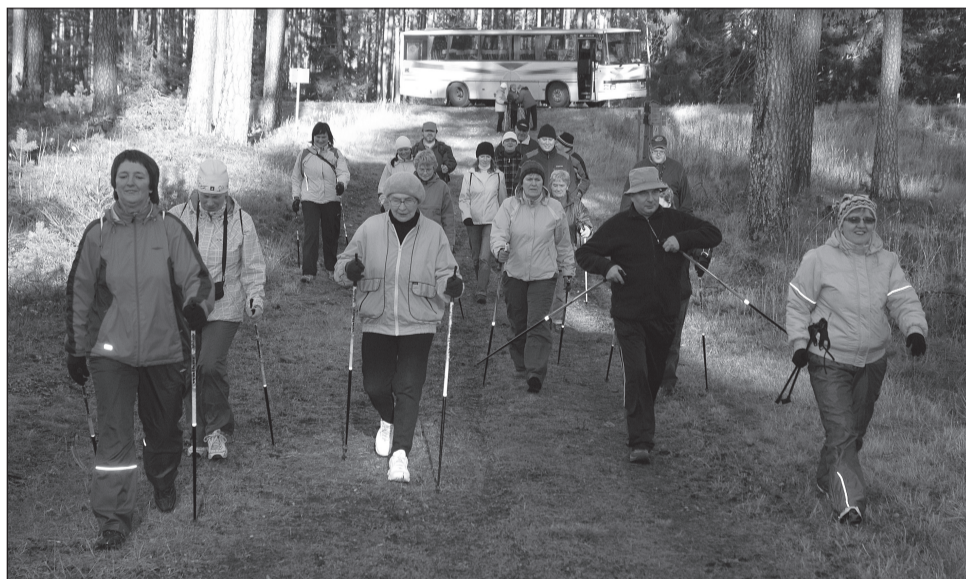
Sellele pildile on jäänud kepikõndijad, kes valisid läbimiseks 10km vahemaa.