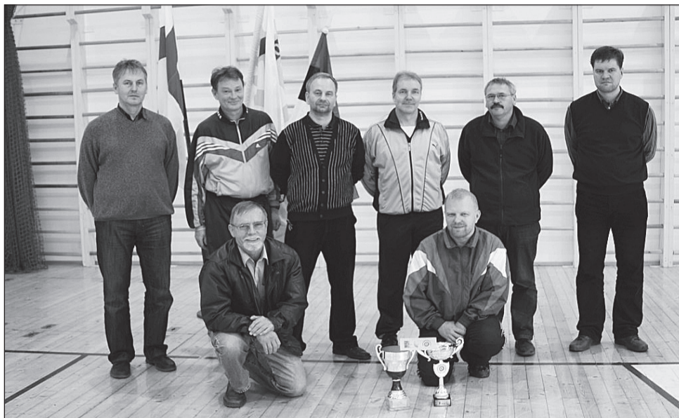
Võidukas Türi rotariaanide meeskond.