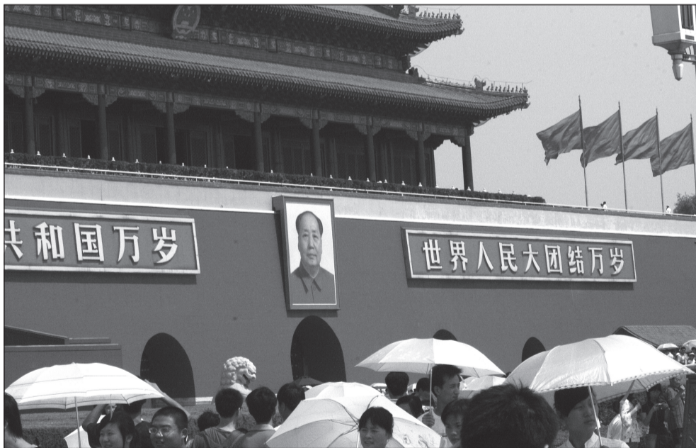
Hiinlaste Suure Juhi Mao Zedongi pilt Keelatud linna sissepääsu juures.