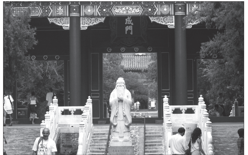
Konfutsiuse templi sissepääsu valvab suure õpetlase kuju.

Kohe meie lähedal ja üpris südalinnas on üks maailma parimini säilinud ajaloolisi paiku, Keelatud Linn, oma arvukate paleekompleksidega, mis on turistidest pidevalt tulvil.