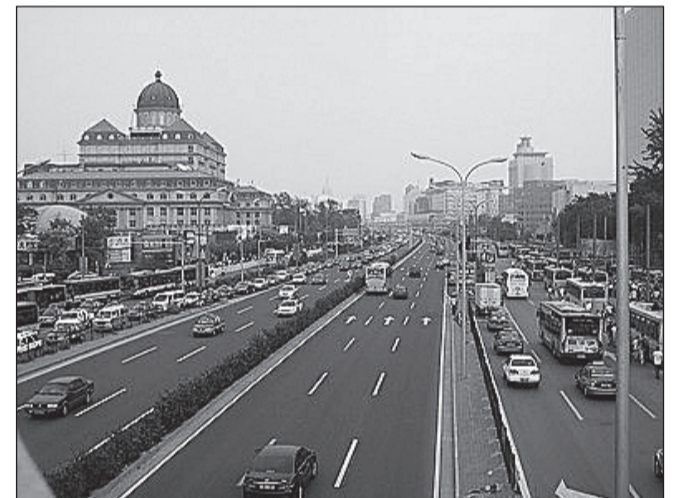
Pekingi linnavaade. Taamal on näha ka sudu.