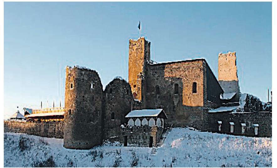
Rakvere linnus pakub huvilistele mitmesugust tegevust.

REFORMIERAKOND Tõnismägi 9 10119 TALLINN