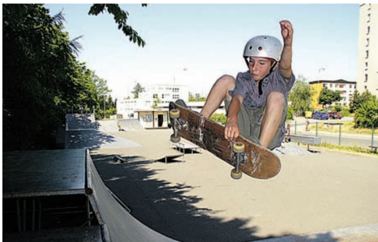
Kui laps rahapuudusel huviringist eemale ei jää, avanevad ka tema võimed varakult.

Ringiraha on mõeldud pearahana kõikidele lastele, kes käivad ükskõik millises huvikoolis, spordiklubis või huviringis sõltumata nende omandivormist. Sõltumata ka sellest, kas huviring on tasuline või tasuta. Lapsevanemal tuleb teha taotlus oma elukohajärgsele omavalitsusele ning sealt suunatakse raha huviringile tema lapse osalustasu hüvitamiseks, kui ring on tasuline. Kui osalustasu huviringis puudub, võib omavalitsus kasutada raha näiteks ringile õppevahendite