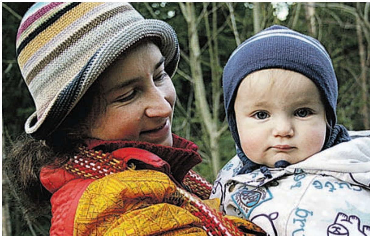
Laps toob peresse rõõmu.

Teame kõik, et Eestis peaks sündima palju rohkem lapsi kui seni. Selleks oleme teinud mitu olulist otsust. Üks neist on kindlasti vanemahüvitis, mida nüüd maksame lapsega kodus olevale vanemale, kuni pisike saab 1,5 aasta vanuseks. Aga oluline on, et meil oleks palju lapsi, kelle vanematele hüvitist maksta. 2006. aastal kiitis Vabariigi Valitsus heaks viljatusravi toetamise aluspõhimõtte. Viljatusravi toetamise üks põhieesmärke on tõsta sündivate laste arvu, et Eesti iive oleks positiivne. Kunstliku viljastamise kuludeks eraldati 40 mln krooni. Lisaks rahastas Haigekassa oma eelarvest kunstlikku viljastamist ja embrüo siirdamist kuni kolme protseduuri ulatuses. Seejuures pidi inimene ise tasuma 30% kõigist kuludest, mis tõenäoliselt sai suureks takistuseks paljudele soovijatele.