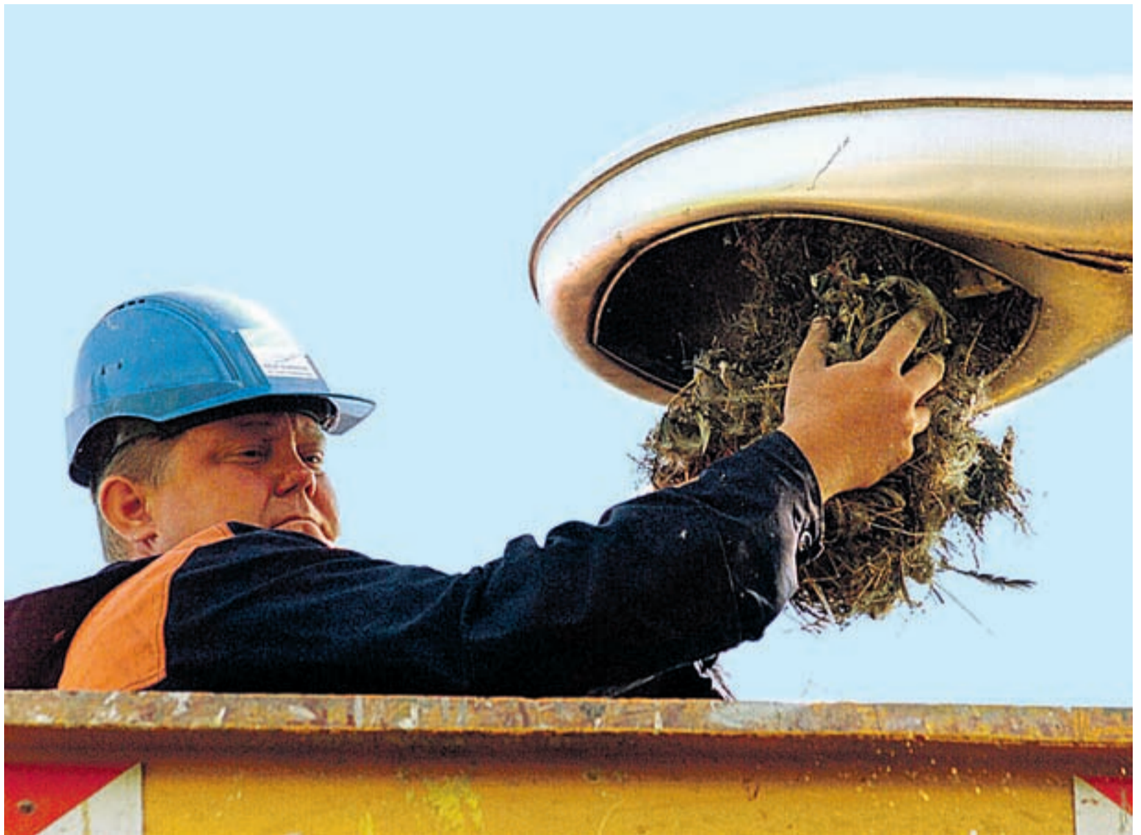
Reformierakonna üheks valimislubaduseks on Virumaa külakeskuste ja teede valgustamine.