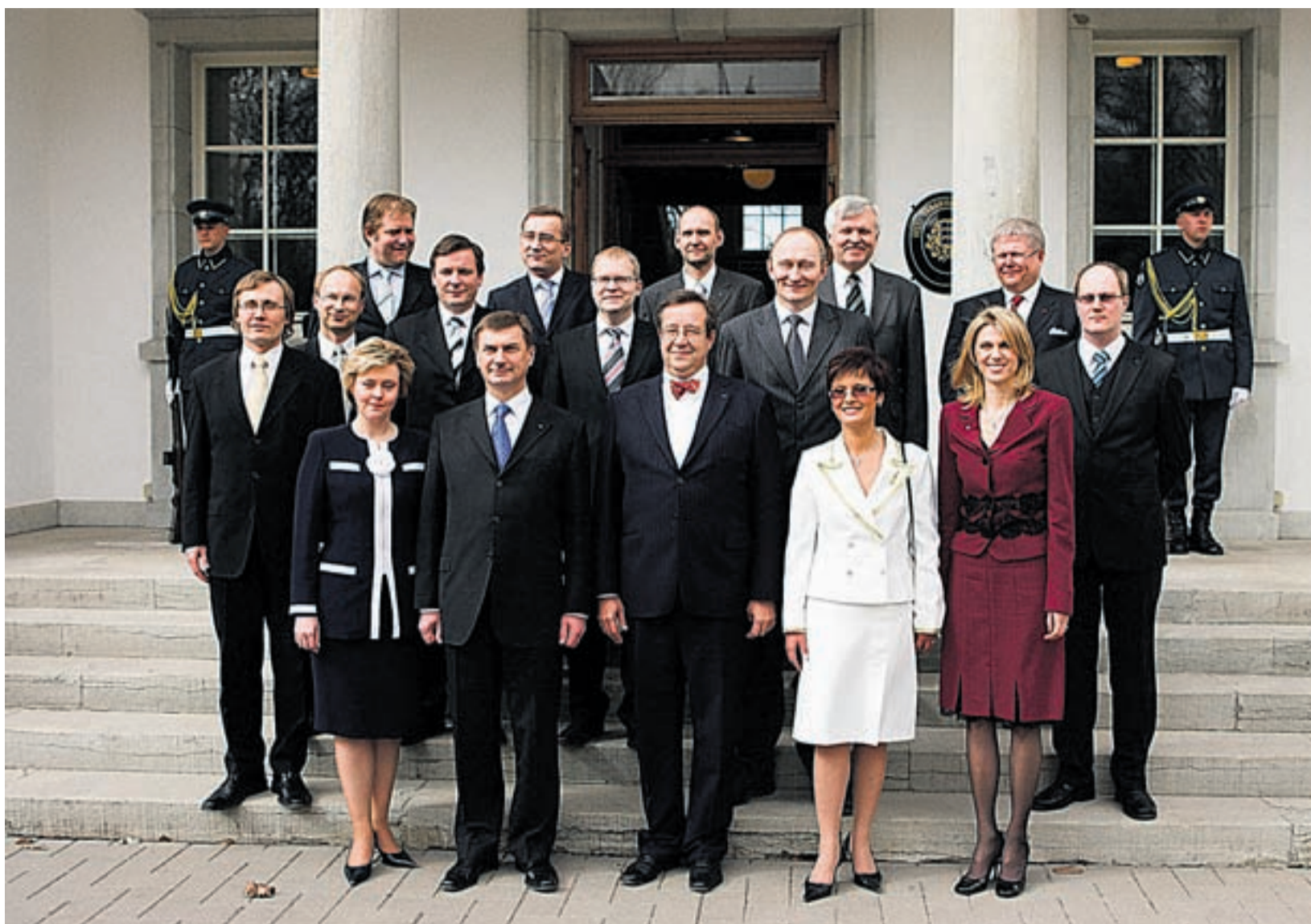
Aastatagune pildimeenus Andrus Ansipi valitsuse ametisseastumisest.

Töömessil, mille eesmärgiks oli viia kokku nii töötajad kui ka tööpakkujad, osales sadu ettevõtjaid ja töövajajaid. Messi korraldas Euroopa Komisjoni INTI projekti raames Kaubandus-Tööstuskoda koostöös Tööturuametiga, Integratsiooni Sihtasutuse ja Rahvastikuministri bürooga. Messil vahendati tööpakkumisi eri vanuses ja erineva hariduse ja keelteoskusega inimestele üle Eesti, pidades silmas niihasti kvalifitseeritud spetsialiste kui ka abipersonali, neid, kes on hetkel töötud, ja ka parema ja tasuvama töökohta otsijaid.