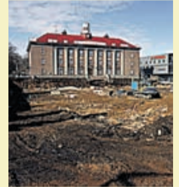
Jõhvis ehitatakse uusi kaubanduspindu.