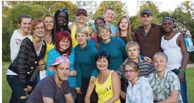
Järvamaa Noortepäev 10.07.2008 korraldusteam ja Makossa trio liikmed.

19.juunil kinnitas haridusmi-nister Tõnis Lukas õigusakti „Elu-keskkonna arendamise rakendus-kava” prioriteetse suuna „Hariduse infrastruktuuri arendamine” meet-me „Avatud noortekeskuste, teavi-tamis- ja nõustamiskeskuste ning huvikoolide kaasajastamine” in-