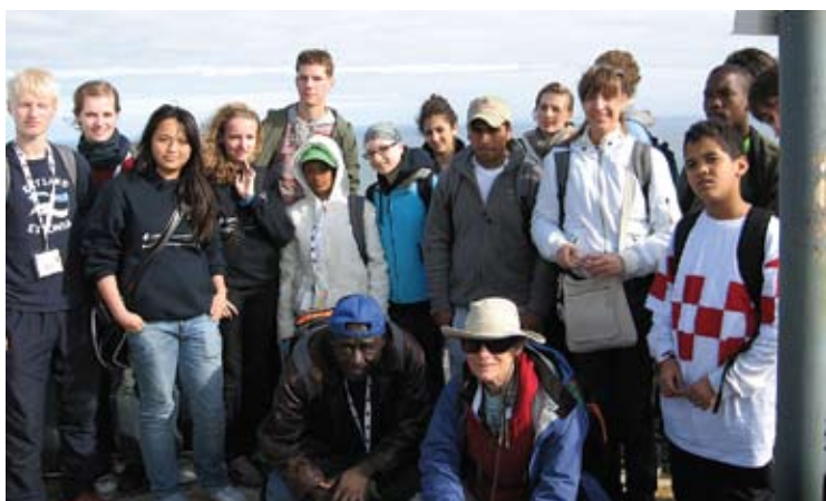
Keskkonnahuvi toob kokku noori ja nende juhendajaid kõikjalt maailmast