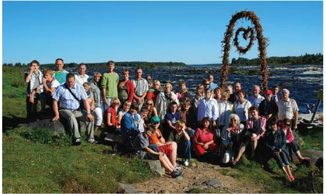
Paidelaste reisiseltskond külastamas Tornio jõe lõhe- ja siiakala rikast kärestikulist piirkonda Kukkolankoskil

Kilomeetrite lõputu rivi keris end rullina spidomeetrisse, keskhommik keeras end küljega lõunasse, pärastlõuna pugese pea õhtuhämarusele kaissu ning