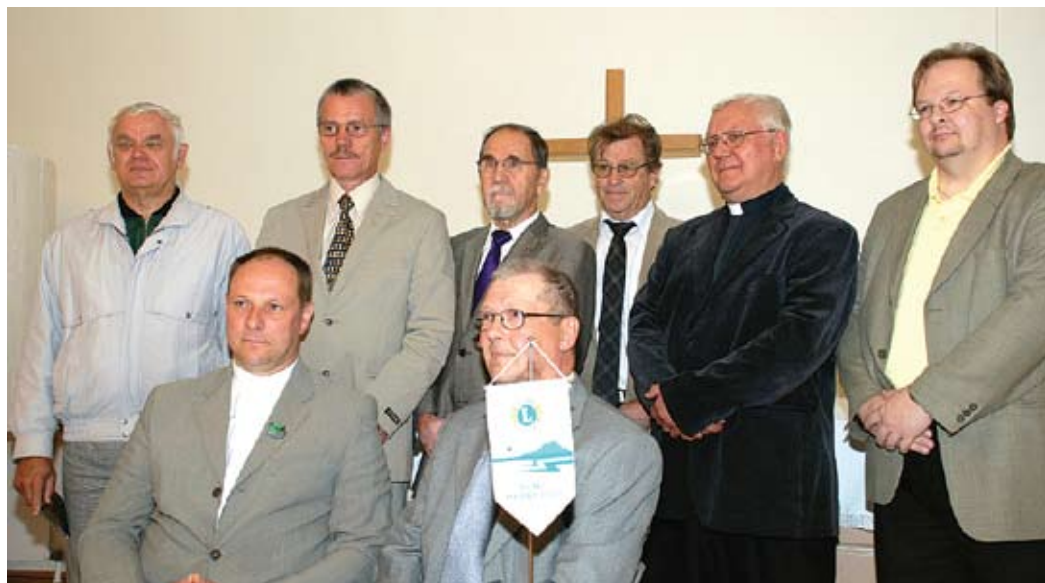
Paide ja Kemi Lions'ite esindajate ühispilet