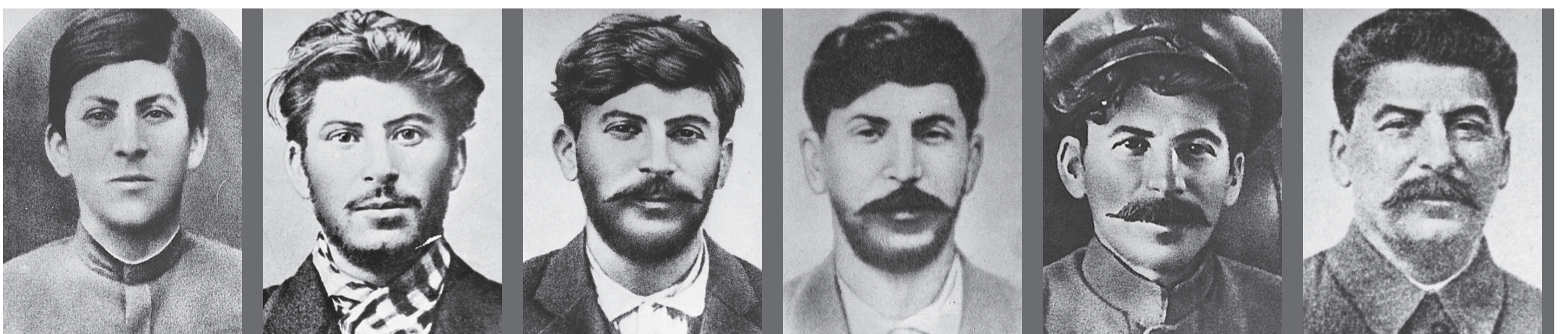
POISIKESEST SIRGUB SAJANDI KURJATEGIJA: vaatamata kõigele on Stalin kogu Gruusias endiselt au sees. Juuresolev galerii on pildistatud Gori linna Stalini-muuseumis.