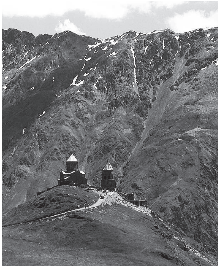
ALPINISTI UNISTUSTE KODU: pisike kirik mäe otsas.