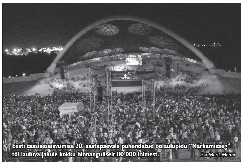
Eesti taasiseseisvumise 20. aastapäevale pühendatud öölaulupeo „Märkamisaeg“ tõi lauluväljakule kokku hinnanguliselt 80 000 inimest.