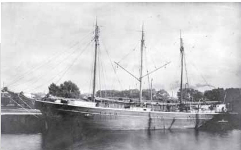
„Viljandi” mahasaetud trengidega ja mootorlaevana.