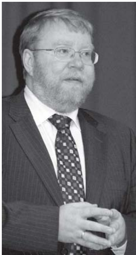
Ajaloolane Mart Laar.