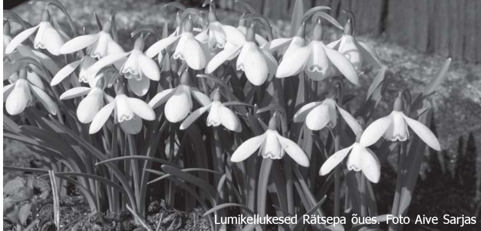
Lumikellukesed Rätsepa õues.

(Väljavõtte Vabariigi Presidendi Toomas Hendrik Ilvese kõnest Eesti Vabariigi väljakuulutamise 90. aastapäeva pidulikul kontsertaktusel Estonia teatris 24. veebruaril 2008)