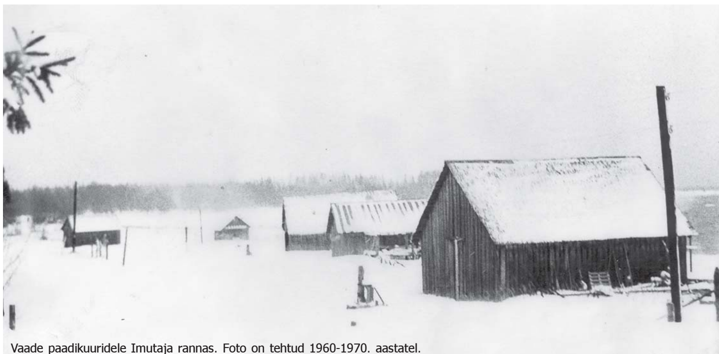
Vaade paadikuuridele Imutaja rannas. Foto on tehtud 1960-1970. aastatel.