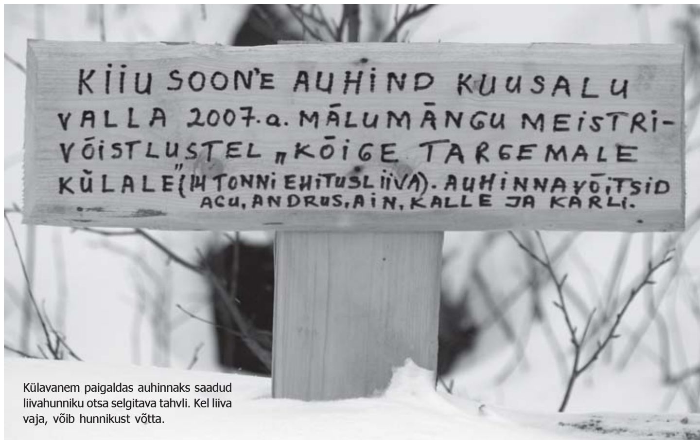
Külavanem paigaldas auhinnaks saadud liivahunniku otsa selgitava tahvli. Kel liiva vaja, võib hunnikust võtta.