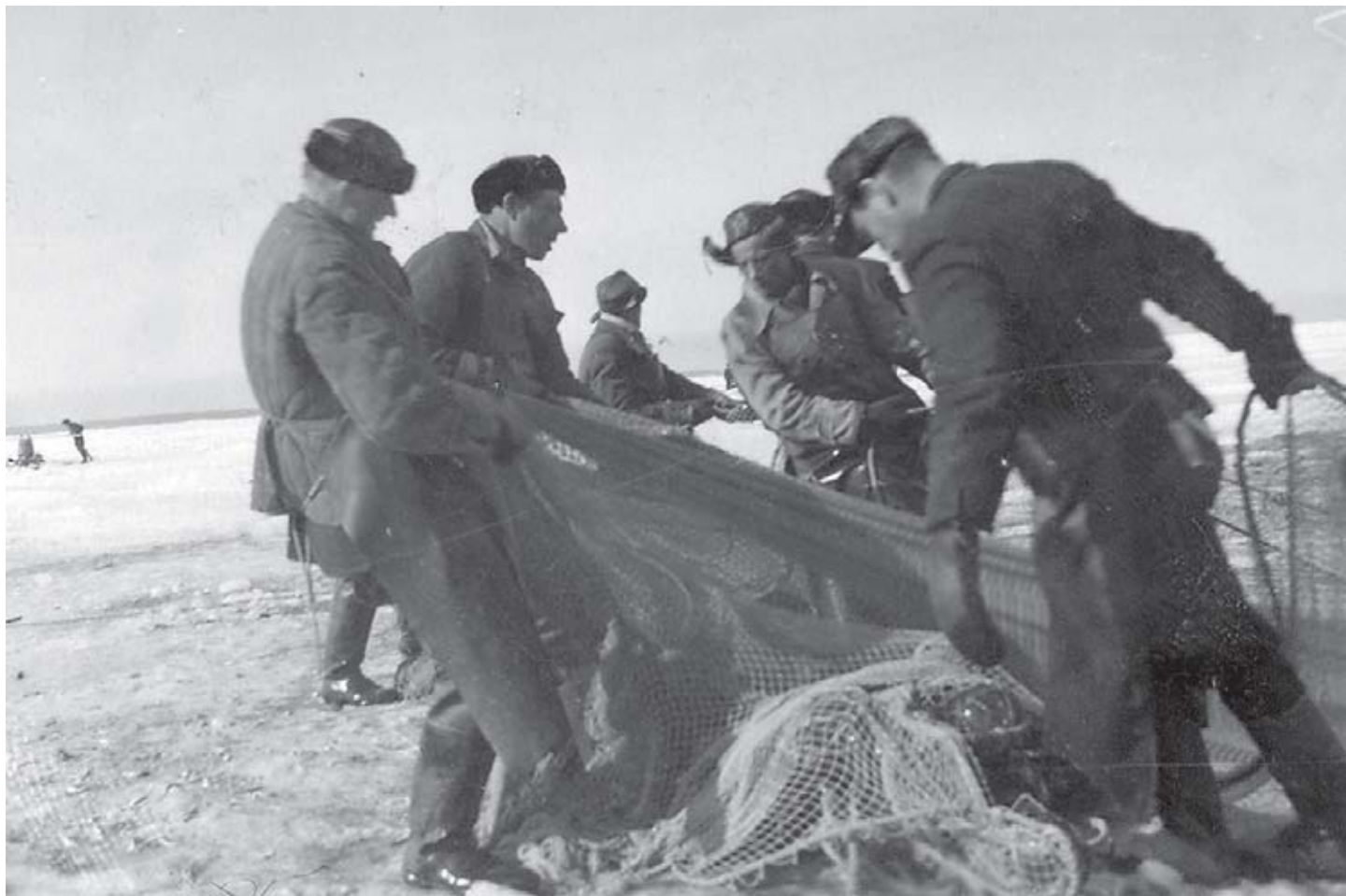
Juminda küla mehed talvisel noodapüügil. Foto on tehtud 1960-1970. aastatel.