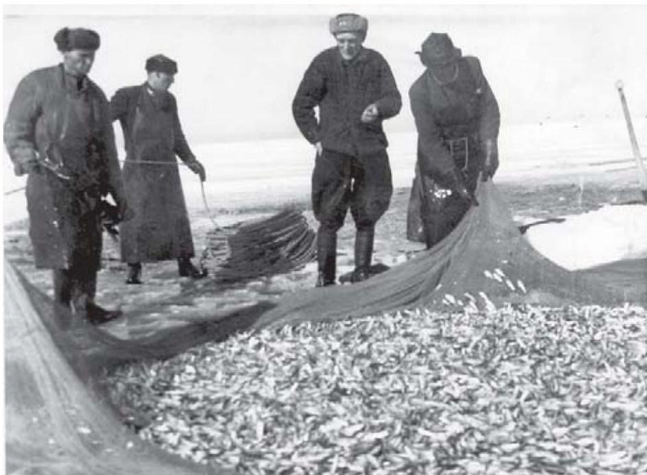
Talvine räimepüük. Foto on tehtud 1960-1970. aastatel.

Esines ka vargust rüsapärade lõhki lõikamise moel. Kord üritanud paar-kümmend raketibaasi sõdalast rüsa tii-