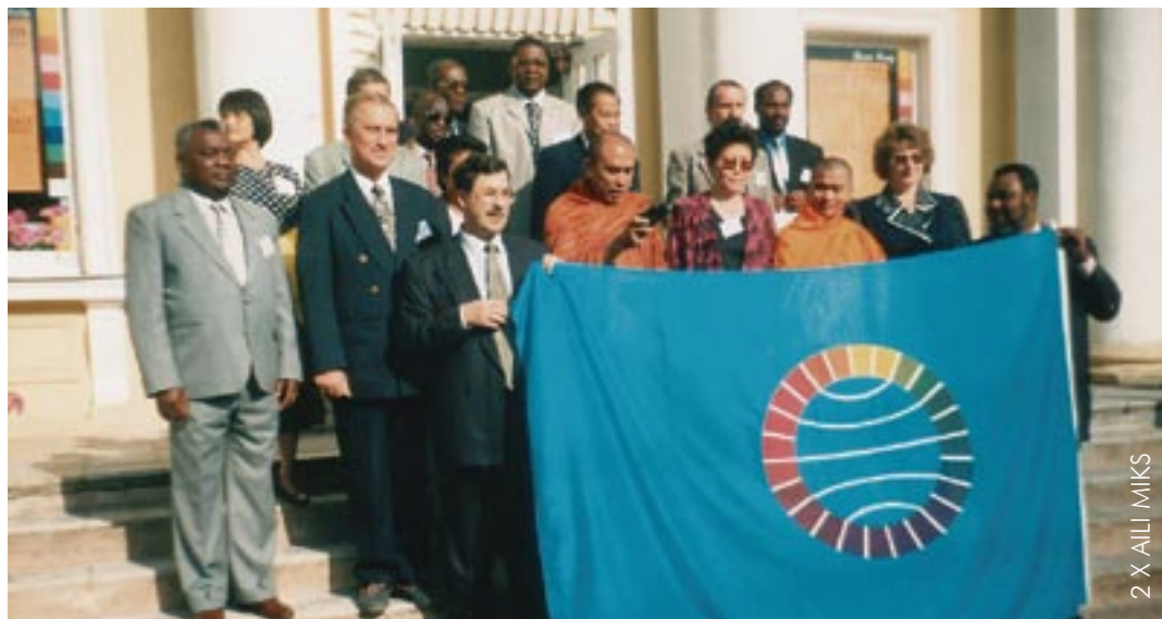
2 X ALLI MIKS

Samast saab lugeda, et ERO on asutatud 11. veebruaril 1991 Haagis 15 rahva delegeritud esindajate osavõtul. Kasvanud on see organisatsioon aga jõudsalt, ühendades 50 liikmesriiki või -rahvast kokku ligi 100 miljoni elanikuga.