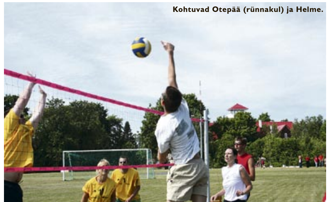
Kohtuvad Otepää (rännakul) ja Helme.