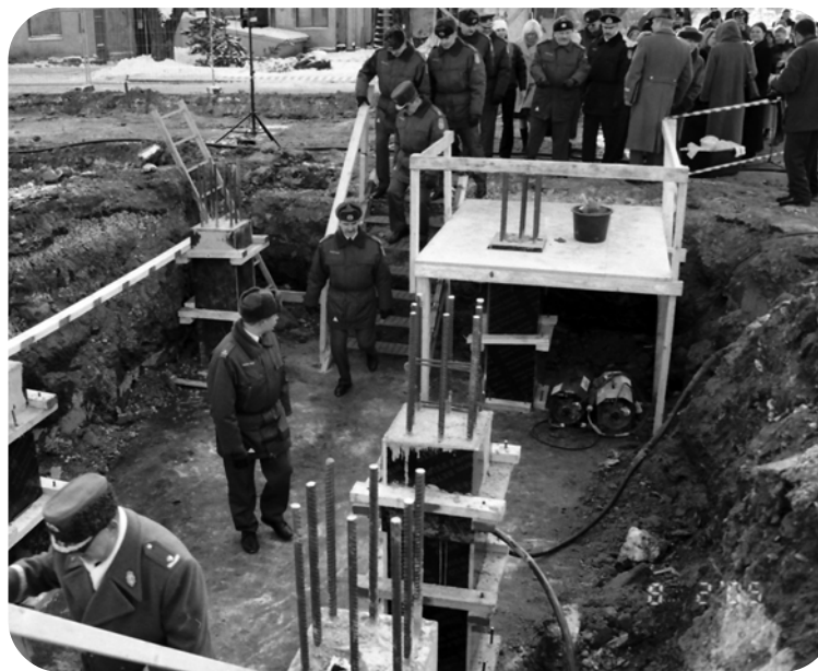
8. veebruaril pandi nurgakivi piirivalveameti uuele staabihoonele aadressil Pärnu maantee 139.

Eluaastad ja ka täitunud eesmärgid on kingituseks.