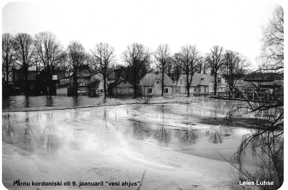
Pärnu kordoniski oli 9. jaanuaril “vesi ahjus”.

Lõpuks, kell 11 õhtul hakkas vesi alanema ja torm raugema. Järgmine päev oli rahulik. Siis soostusid ka need, kes olid teisele korrusele peitu pugenud, kodudest lahkuma, et mis