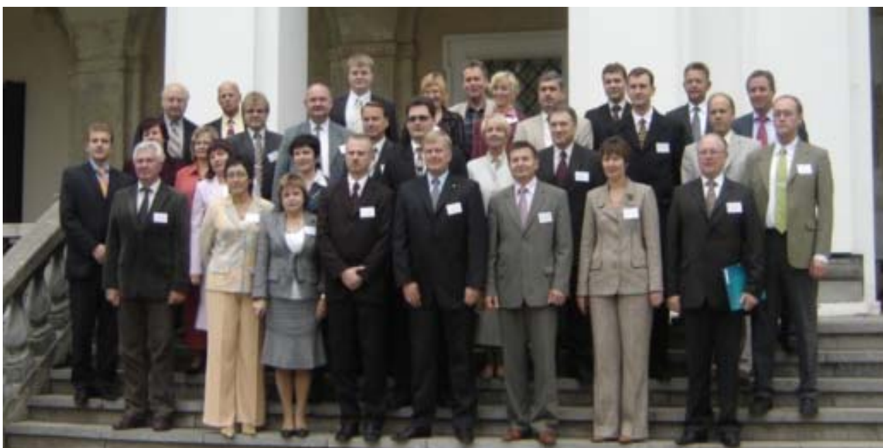
Balti Riikide Kohtunike Ühingute Nõukogu 28.-29.09.2006 konverentsist osavõtjad

2006. AASTA KONVERENTSI TEEMAKS OLI "KOHTUNIKE EETIKA KÜSIMUSED"