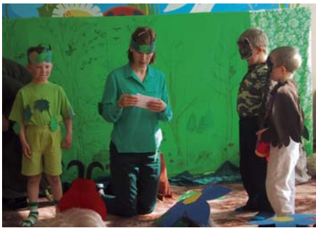
Lehelappajad öökullide poolt kätte toimetatud kirja lugemas

20. mail toimus lasteaias näidendi "Metsahaldjad teevad peo" esietendus. Selle piduliku sündmuse puhul olid publikuks tulnud nii lapsevanemad, kooli algklassilapsed kui ka muidu huvilised, kes said nii veeta meeleoluka hommikupooliku.