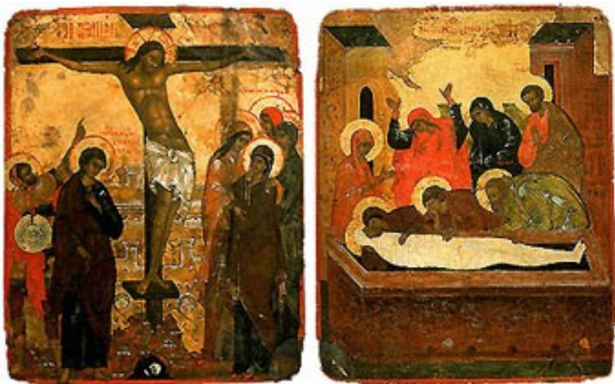
Ristilöömine Püha Andrei (Rubljov), 16. saj.