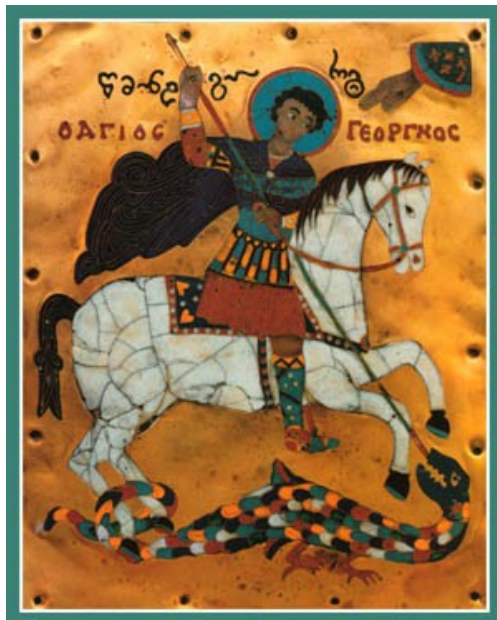
Püha Jüri (24. aprill) Gruusia, 12.-13. s.