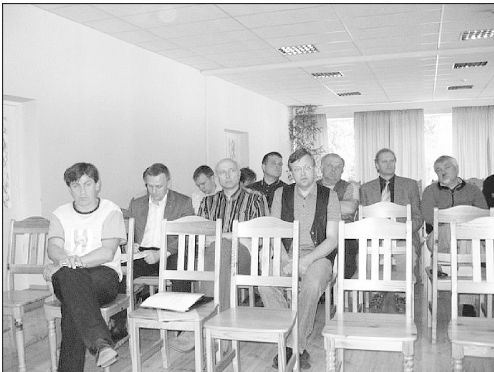
EMÜ üldkogu Elvas.