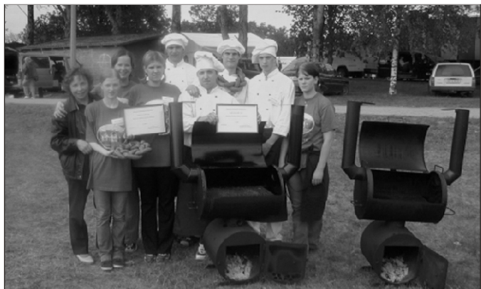
Olustvere võistlajad "Sarvikutega"