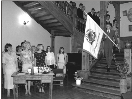
Olustvere Põhikooli lõpuaktus