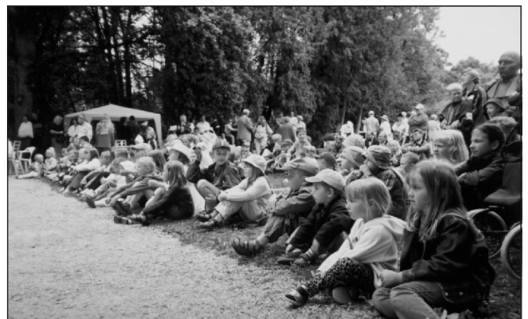
Väikesed pargipeolised etendust nautimas