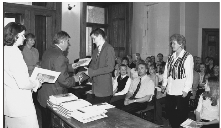
Suure-Jaani linnapea ja vallavanem võtsid Olustvere lossis vastu Suure-Jaani Gümnaasiumi tublimaid õpilasi, nende vanemaid ja õpetajaid.