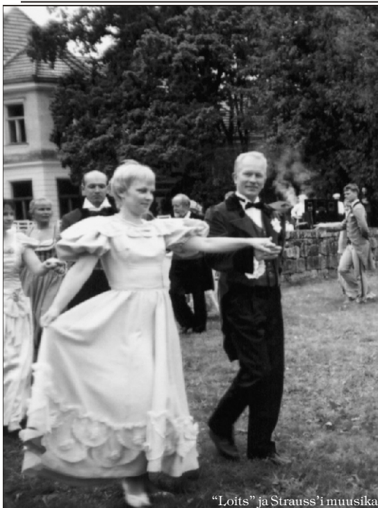
"Loitsu" ja Strauss'i muusika