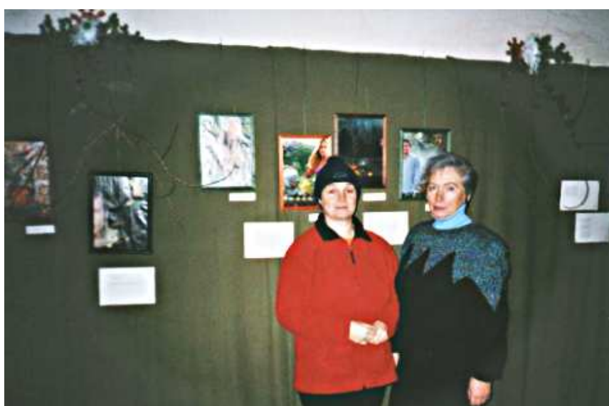
ENNE AVAMIST: Kallaste raamatukogu loovusringi liikmed valmistuvad Alatskivi lossis näituseks “Kalevipoeg? Üks mitteennemuistne jutt?”

Kui tavaliselt olen andnud loovusringi liikmetele luule teemal rohkem vaba valiku, siis need tööd eeldasid konkreetsust.