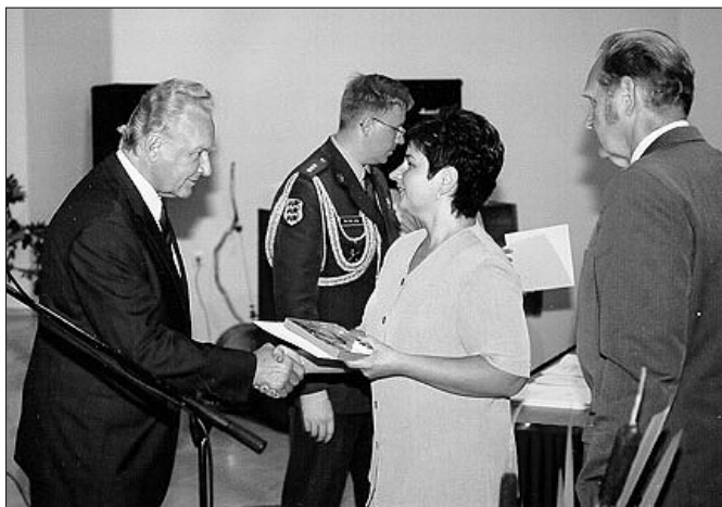
President Arnold Rüttili käest võtavad Olustvere aleviku auhinna vastu Kersti Kulla ja Taivo Teder.