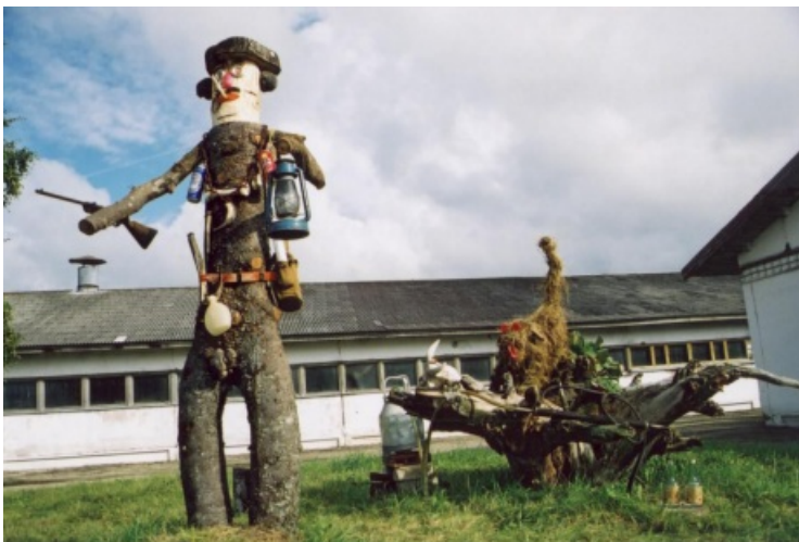
Üks auhinnatutest - Sürgavere veisefarm