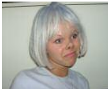
Milli Vanilli arvab:

tutipäev, kus pidime end tittedeks ümber riietuma— KÄMMM OON, mina ja titeks, saatsin kohe pikalt selle ürituse ja läksin hoopis plikadega linna peale lantima.