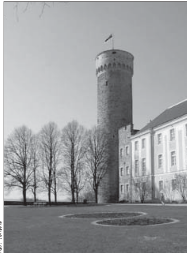
Vabaduse sümbolid - Pikk Herman ja sinimustvalge.

Aastaid menuansamblik on olnud „Meie Mees” toob nagu võluväl peoplatsile kõik, kel