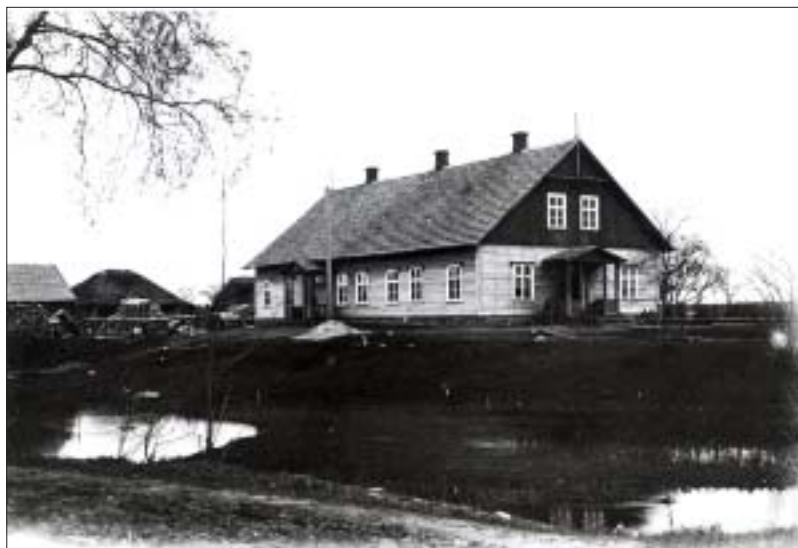
Veelikse koolimaja 1910-1920ndad