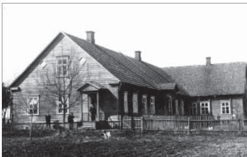
Voltveti 6-klassiline algkool, 1923.