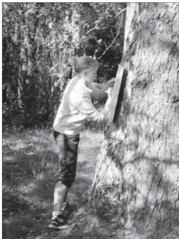
Gaid ja puu.

M a t k a -mängu tulemused vanuserühmade kaupa olid sellised: 1 Jagd-kommando ( ekstreemrada ) Pärnu Rääma rühm 2 MPG-2 (ekstreem) Pärnu lastekodu 3 MPG (ekstreem) Pärnu lastekodu 4 Pärnu padrunid (ekstreem) Pärnu Rääma rühm 5 Tondisalu (ekstreem) Tondisalu lipkond Tallinnast 6 Sitakäi (ekstreem) Pärnu 7 Tori gaidid a la hobused udus (ekstreem) Tori gaidid 1 Kolmas taldrik ( suur rada ) Tallinna kodutütreid 2 Plumps (suur rada) Tallinna kodutütreid