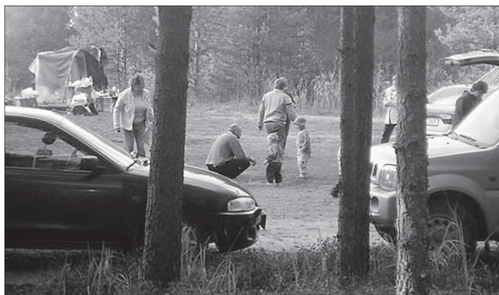
Eemale linnakärast, et õppida tundma loodust meie ümber, avastada selle ilu ja saladusi.