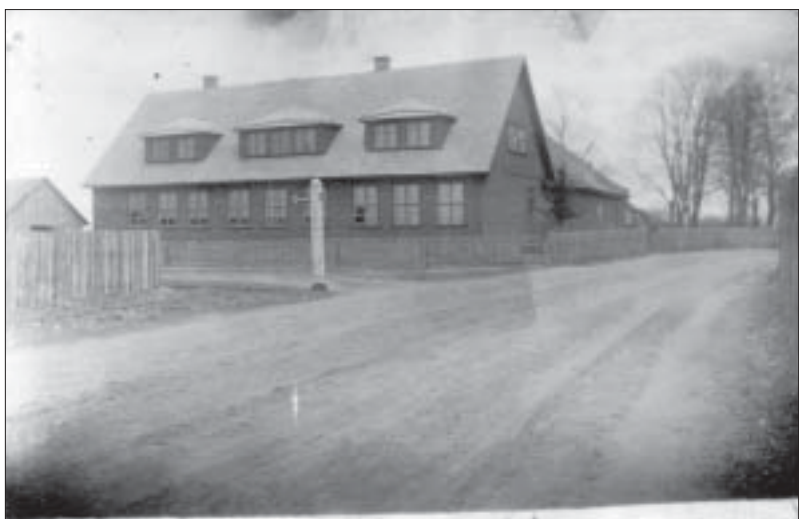
Laiksaare 6kl algkool.