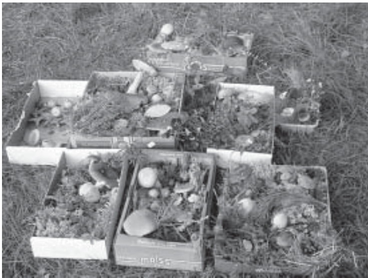
Pärast seenerallit said pered ülesandeks metsast leitud andidest valmistada väike üllatus teistele.

Saabunud on sügis ja krõllipesas käimas sügismatkad ja piknikud. Väikesed ja suured Sipsikud käisid möödunud kevadel piknikul Rae järve ääres ning see meeldis lastele ja nende vanematele nii väga, et seekord otustati sihtpunktiks võtta Niksi raba: eemale linnakärast, et õppida tundma loodust meie ümber, avastada selle ilu ja saladusi. Lõbusad ja seiklushimulised lapsed suundusid koos vanematega autodesse-