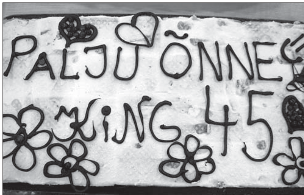
VÕITJAKOOK: 7a klassi küpsetis.

maid, kes abistasid küpsetiste valmistamise juures, ning kiita kõiki õpilasi, kes ise küpsetasid!