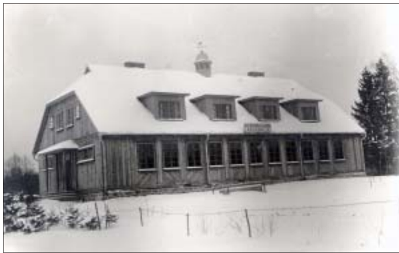
Pati koolimaja (Risitikülas), 1910.