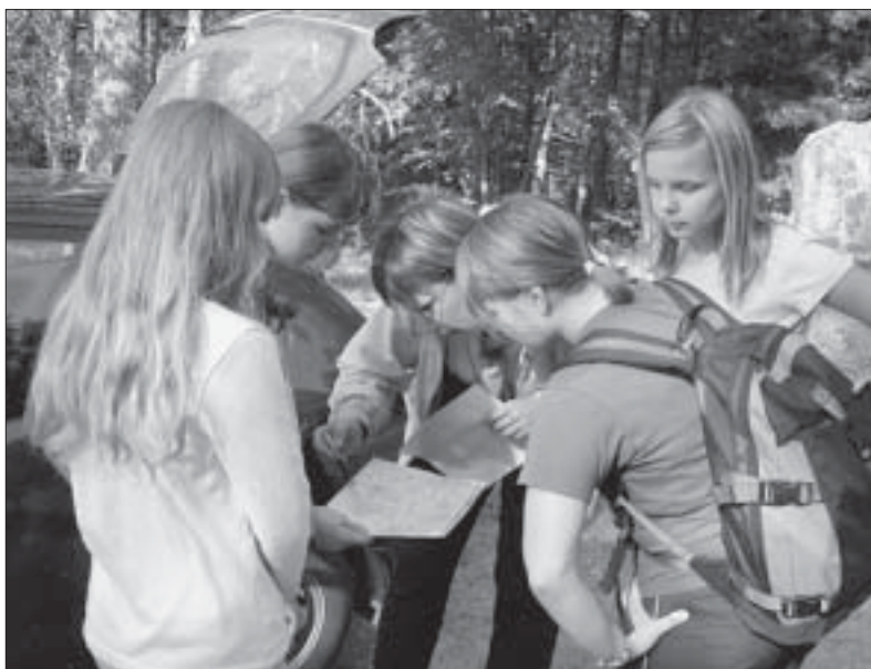
Iga võistkond võis valida kolme raskusastme vahel: väike rada, suur rada ja ekstreemrada.

Huvitav lugu oli esimeses kontrollpunktis, kus lisaks ajalooalastele teadmistele tuli mängijatel joonistada ka Saarde valla vapilooma. Ilvese joo-