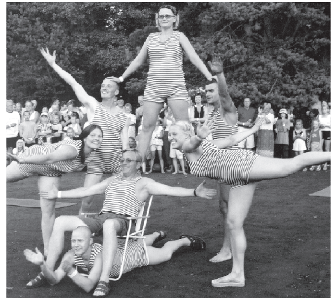
Isetegevusliku võimlemiskava ühe hoogsama ja läbimõelduma etteaste sooritasid "madrused" Pärnu kandi hülgepüügi alustelt.

Merepäevalisi leebe tuule ja sooja mereveega õnnistanud Neptun paistis rahule jäävat.