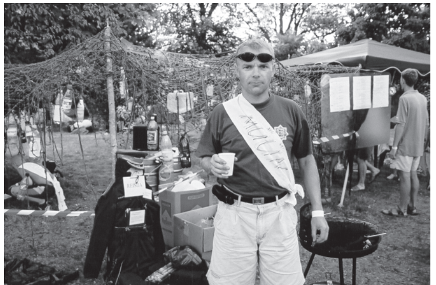
Salapiirituse smugeldajate bangalole tegid au nii terve ja rõõmsa olemise-ga müüjad kui tarbijad. Väikese "vaevatasu" eest ei öedlud ära kellelegi.