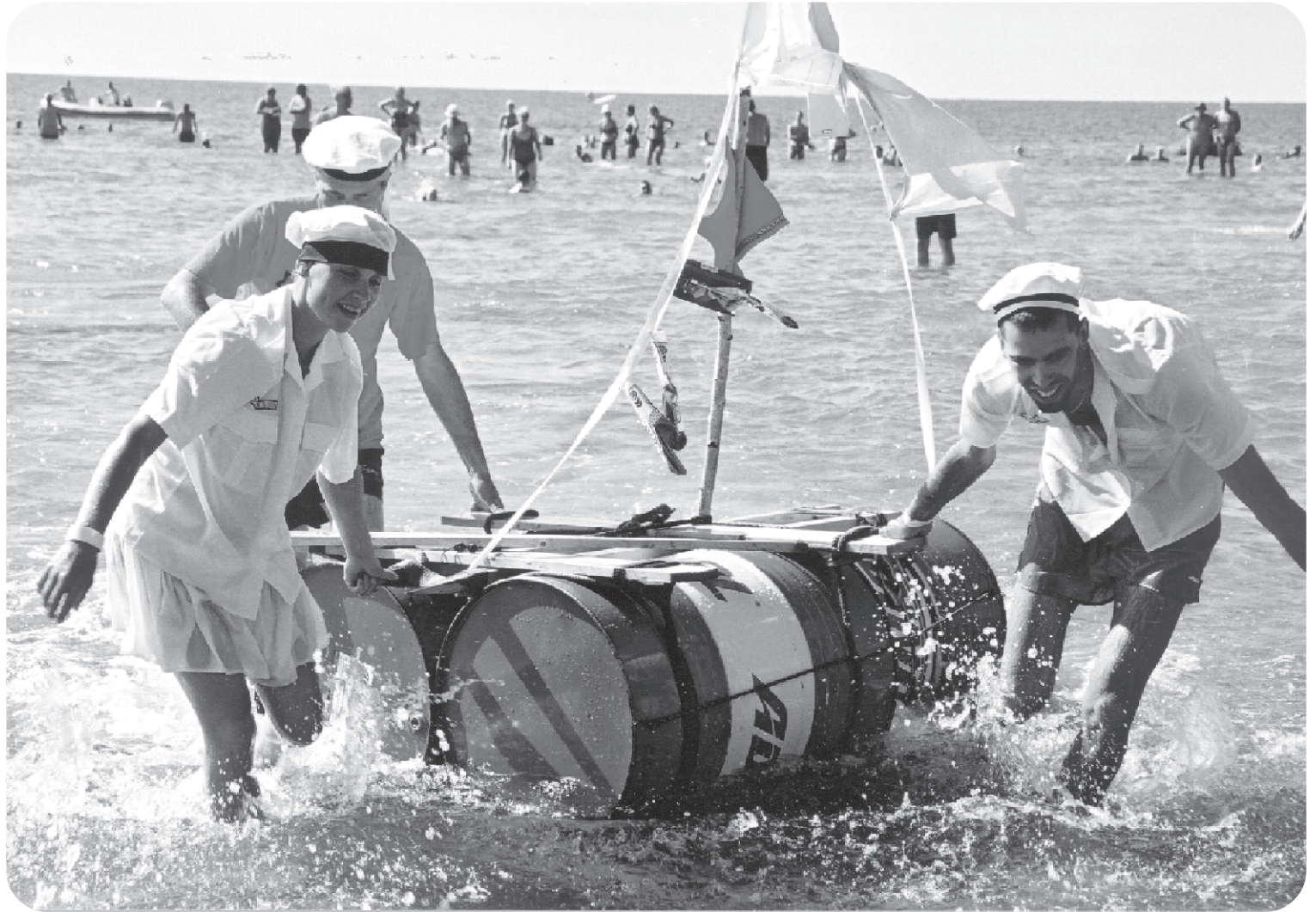
Seekordsete perepäevade vaieldamatuks tõmbenumbriks kujunes isetehtud ujuvvahenditel mereavarustesse pagemine. Pildil peopere-meeste võistkond oma uhke, kuid lainetes laisavõitu ununud laevukesega.