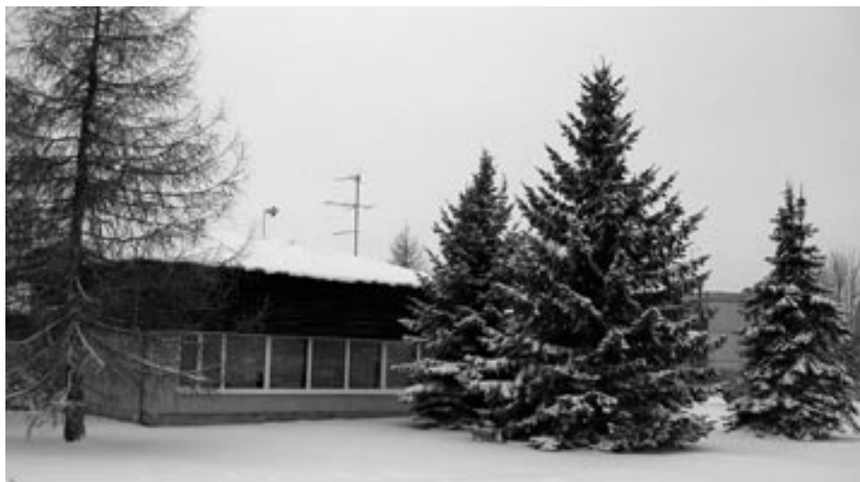
Puhja lasteaed