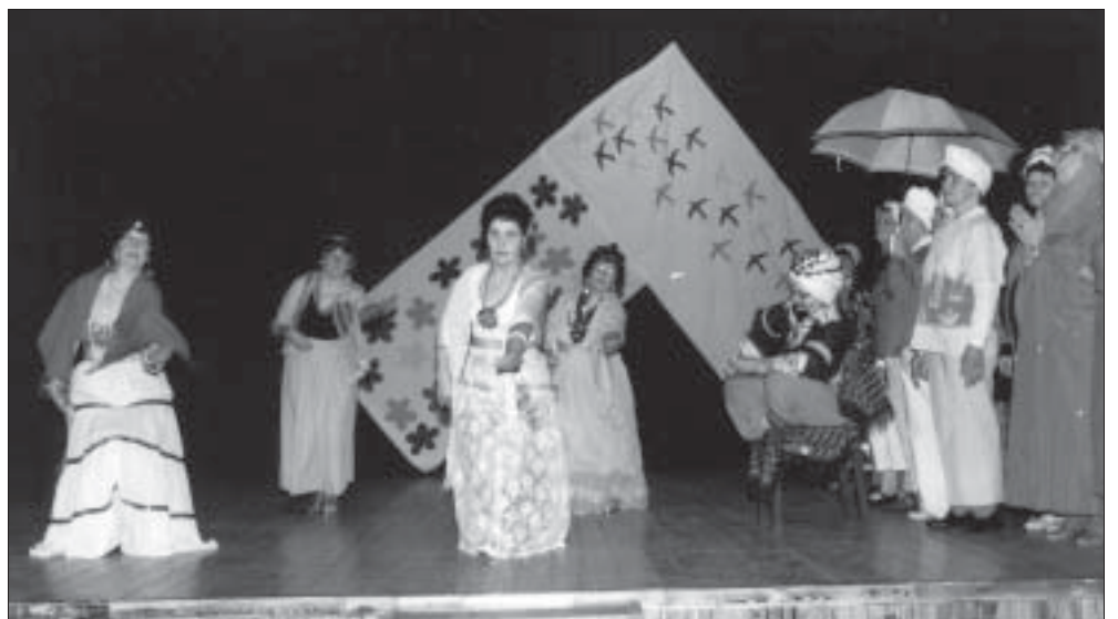
1997. a. kevad Treimanis memme-taadi päeval. Esinevad haaremitantsijad.