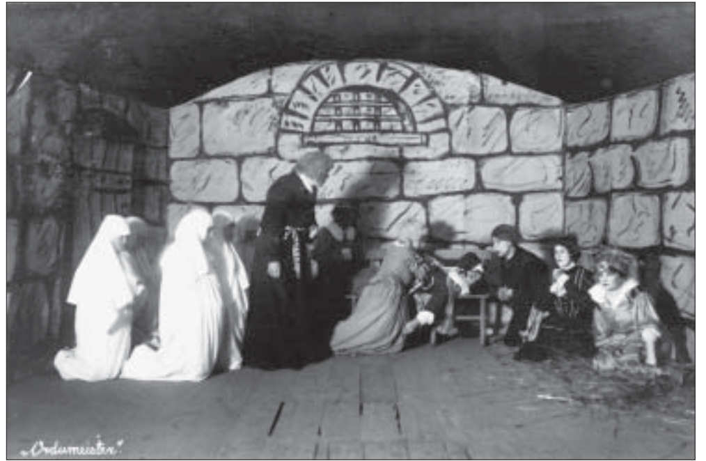
Kilingi-Nõmmes 1928. aastal. Näitemäng Tuletõrje seltsi laval.

Kui maanimene sõitis ho- busega Pärnu linna, pidi ta arvestama uute sillamaksu hindadega, mis kehtisid alates 21. märtsist. Suurtest sildadest ülesõidu või veo eest tuli maksta: ühehobuse veo- või sõiduvankri, saani ja ree pealt ühes hobusega 5 senti; kahe- hobuse sõiduriistade - posti- vankri, saani pealt 2 hobuse- ga - 10 senti; ühehobuse voo- rimehe sõiduriista või saani pealt ühes hobusega edasi- tagasi sõites - 10 senti; kaheho- buse voorimaks - 15 senti; ka- hehobuse prahivankri pealt 2 hobusega - 10 senti; rakenda- mata hobuse pealt - 3 senti;