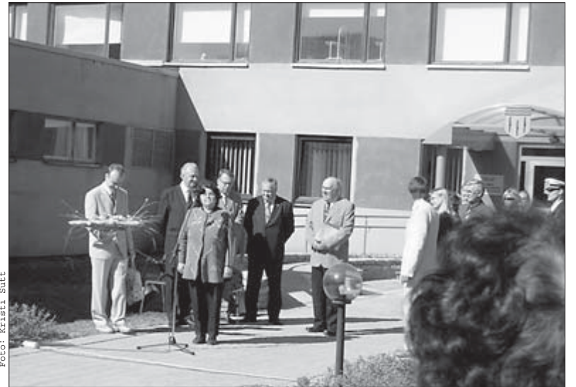
Kilingi-Nõmme delegatsioon tiitlit üle andmas.

Ekskursioonid viisid meid haavapuidumassi tehasesse, tsemenditeha-