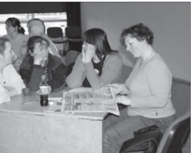
Võidukad naised metsast ammutavad värsked teadmisi kuni viimse hetkeni.

Hooaja viimase mälumängu võitis „Metsanaiste” viisik Tihemetsast. Sügisel 19. septembril alustatakse uue hooa. Oodatud on kõik mälumänguhuvilised!