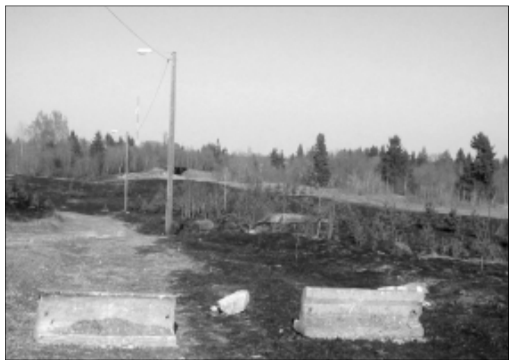
Männikumäe terviseradadel põlesid 7. mail koos kuluga ka 8-aastased männid. Palve Tapa elanikele, kes näevad Männikumäel vandaalitsemist: helistage telefonil 110.