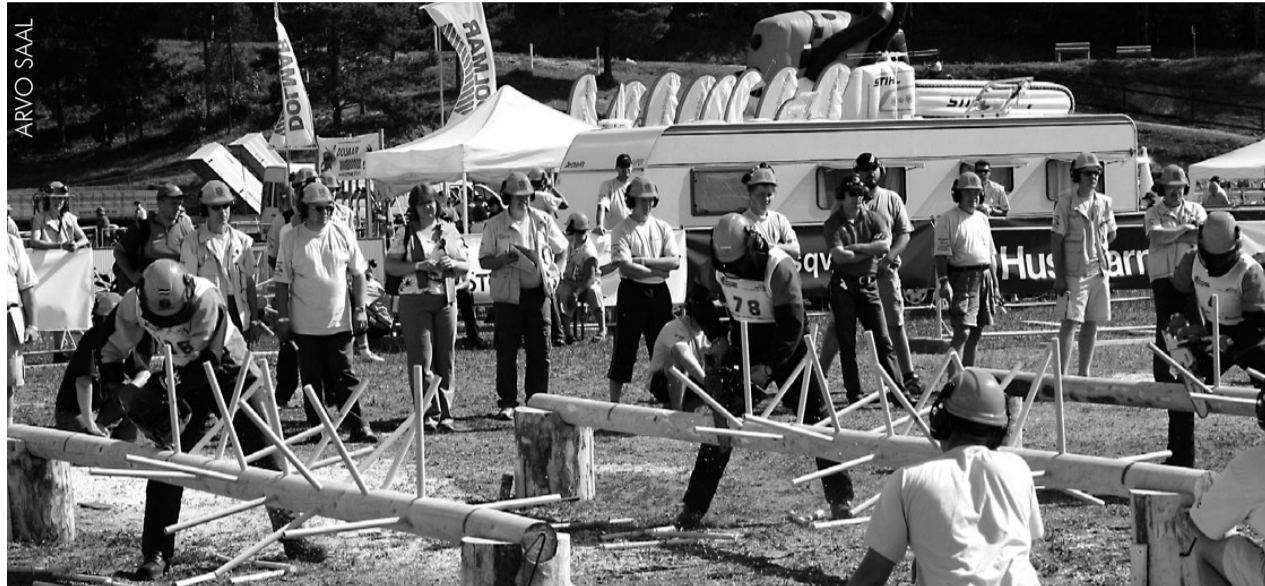
Selliseid "puid" laasisid võistlejad MMil.

Kokku osales Otepääl 106 võistlejat 27 riigist. Maailmameister selgus viie