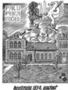
Koolituba 1934. aastast

Küllastusmängus osalejate (vähemalt 10 Eestimaa mõisat külastanud inimesed) vahel loositakse välja 40 kutset Rägavere mõisas toimuvale Rakvere teatri etendusele «Pidusöök».