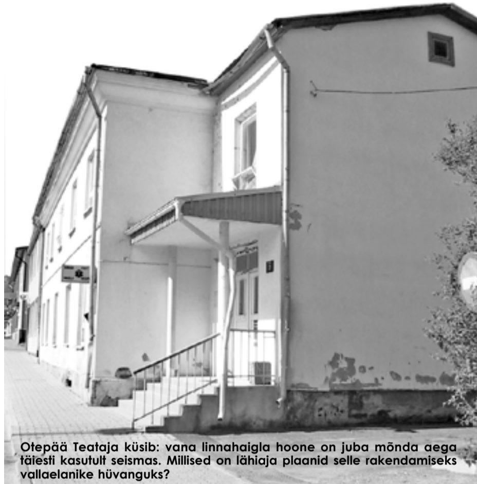
Otepää Teataja küsib: vana linnahaigla hoone on juba mõnda aega täiesti kasutult seismas. Millised on lähiaja plaanid selle rakendamiseks vallaelanike hüvanguks?