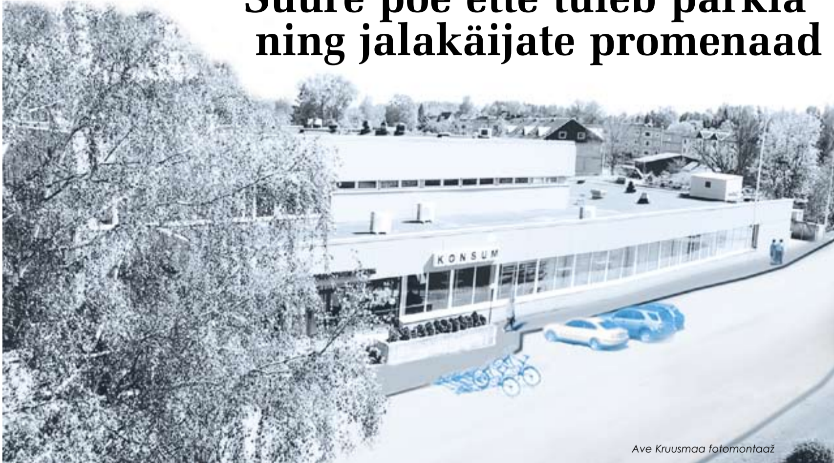
Ave Kruusmaa fotomontaaž

Praegune Konsumi «kaunite vaateakende» all kulgev jalakäijate ala piiritletakse 2,5 meetriseks kõnniteeks, selle ette rajatakse ca 13 meetri laiune 13 sõidukit mahutav parkla koos pääsuteedega turuplatsi kaudu Munamäe ja Kopli tänavatele ning Lipuväljaku kaudu Valga maanteele. Pooledisemeetrise mururibaga eraldatakse rajatav 4 meetri laiune jalakäijate promenaad, mis algab turuplatsil ning suundub üle vana bussijaama platsi uuele bussijaamaplatsile Tartu ja Valga maantee vahelisel alal.