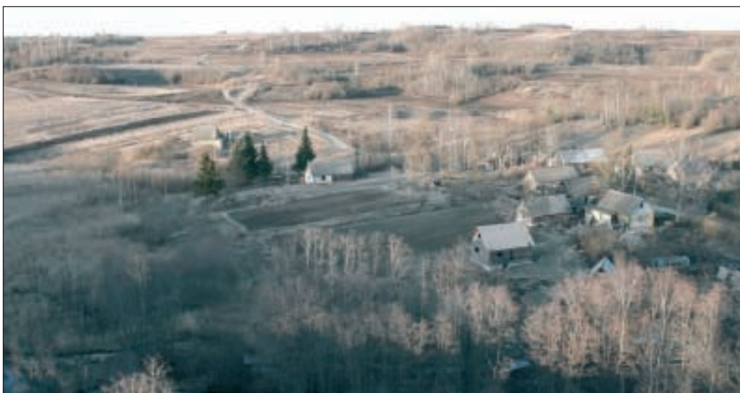
Vaade setode maale Irboska kindlusest aprillis 2004.

Lõplikult allkirjastati Tartu rahuleping 2. veebruaril 1920 kell 00:45. Venemaa tunnustas tingimusteta Eesti iseseisvust ja loobus igaveseks ajaks kõigist varasemastest õigustest Eesti suhtes. Tartu Rahu võib nimetada Eesti iseseisvuse sünnitunnistuseks. Setomaa liitumine Eesti Vabariigiga tähendas Setomaaale tõelist revolutsiooni: koolid ja ametiasutused eesti keeles, anti perekonnanimed ja lõpetati hingemaade jagamine.