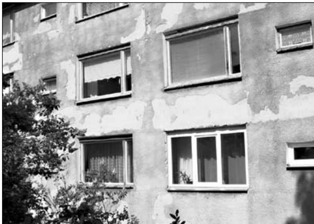
Aknaplokkide kuju muutmist kavandades tuleb maja lahendada tervikuna, see eeldab ehitusprojekti koostamist. Ilma projektita võib aknaid asendada vaid olemasoleva eeskujul.

Ehitusseadus on väga sisutihed, seda ümber jutustada pole mõtet, iga juhtum vajab eraldi lähenemist. Näiteks võib ilma loata