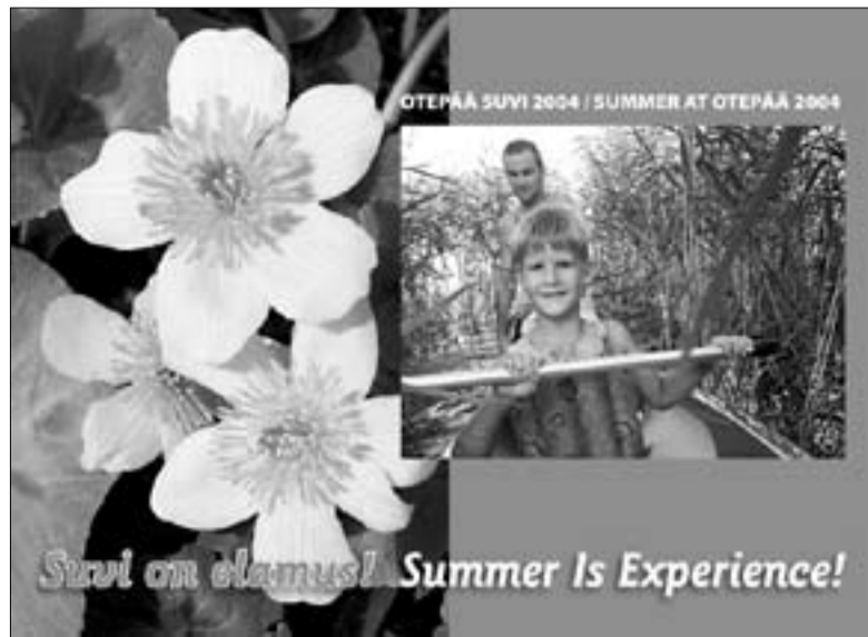
Trükise «Suvi on elamus!» esikaas.

Liikumisradade kaarti saab osta Otepää turismiinfokeskusest ning neist piirkonna turismiettevõtetest, kes on selle müügiks soovi avaldanud. Kaardi väljaandmist finantseeris Otepää vallavalitsus, projekti partneriteks on radade haldajad: MTÜ Kekkose Rada, klubi Tartu Maraton, Otepää Looduspark ja Tehvandi olümpiakeskus.