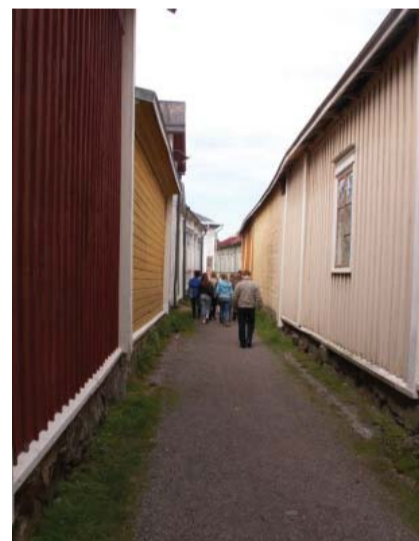
Soome kitsaim Kitukränni tänav Rauma vanalinnas.