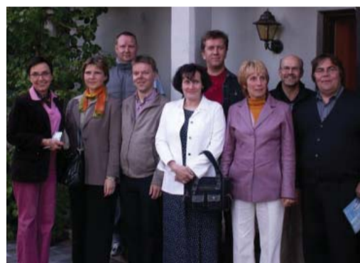
Tabasalu ja Eura õpetajad Suontausta muuseumi ees.