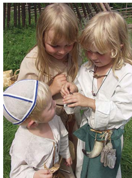
Eurast taaselustatakse rauaaegset elu